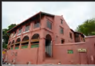
MUZIUM SENI BINA MALAYSIA, BANDAR HILIR, MELAKA