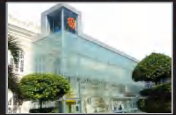
MUZIUM TEKSTIL NEGARA, KUALA LUMPUR