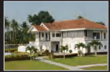
MUZIUM MATANG, PERAK