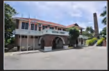
MUZIUM CHIMNEY, LABUAN