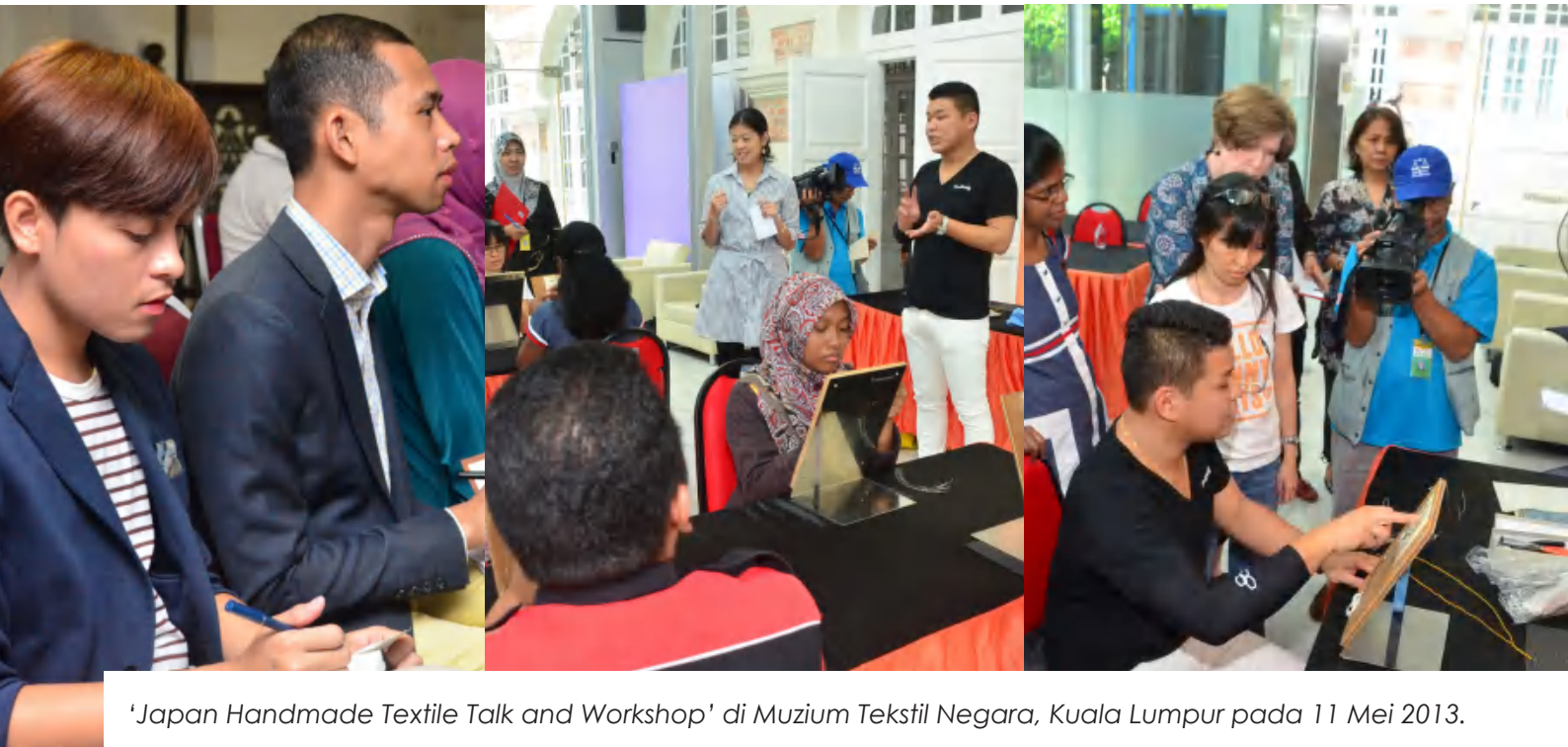
'Japan Handmade Textile Talk and Workshop' di Muzium Tekstil Negara, Kuala Lumpur pada 11 Mei 2013.