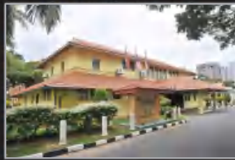
MUZIUM LABUAN, LABUAN