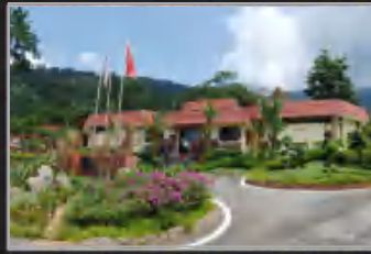
MUZIUM ARKEOLOGI LEMBAH BUJANG, KEDAH