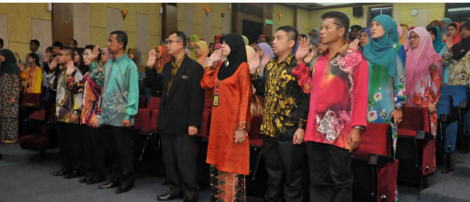
Perhimpunan Bulanan JMM Bil. 4/2013 di Auditorium Jabatan Muzium Malaysia pada 26 Ogos 2013.