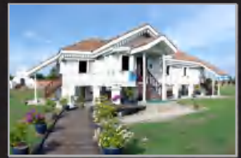
MUZIUM KOTA KUALA KEDAH, KEDAH