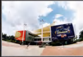
MUZIUM AUTOMOBIL NASIONAL, SEPANG