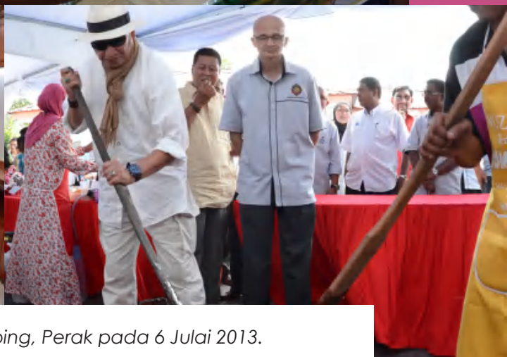
Program Muzium Bersama Komuniti di Muzium Perak, Taiping, Perak pada 6 Julai 2013.