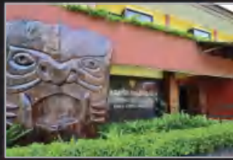
MUZIUM SENI KRAF ORANG ASLI, KUALA LUMPUR