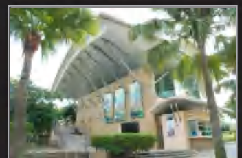
MUZIUM ALAM SEMULA JADI, PUTRAJAYA