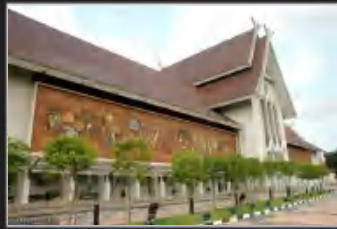
MUZIUM NEGARA, KUALA LUMPUR