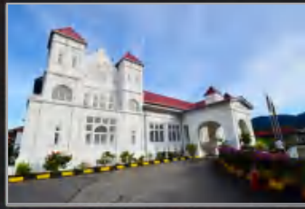
MUZIUM PERAK, TAIPING, PERAK