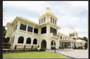
MUZIUM DIRAJA, KUALA LUMPUR