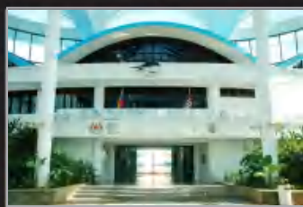
MUZIUM MARIN LABUAN, LABUAN