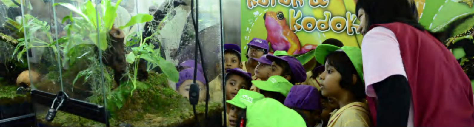
Sidang Media Pameran Katak dan Kodok di Muzium Alam Semula Jadi, Putrajaya pada 22 Mac 2013.