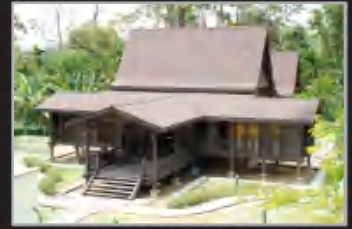
MUZIUM KOTA JOHOR LAMA, JOHOR