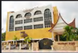
MUZIUM ADAT, JELEBU, NEGERI SEMBILAN