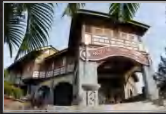
MUZIUM SUNGAI LEMBING, PAHANG