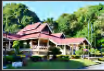
MUZIUM KOTA KAYANG, PERLIS