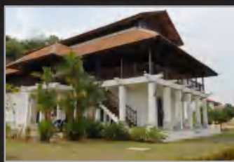
MUZIUM LUKUT, NEGERI SEMBILAN