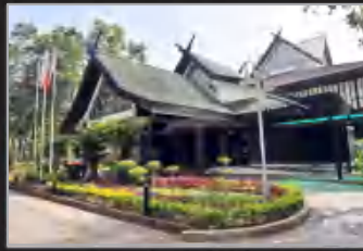
GALERI PERDANA, LANGKAUI