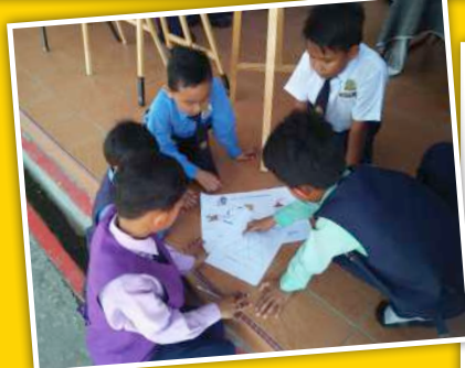
Aktiviti Question Hunt murid darjah tiga yang memberi peluang mengenali bahan pameran di muzium melalui permainan