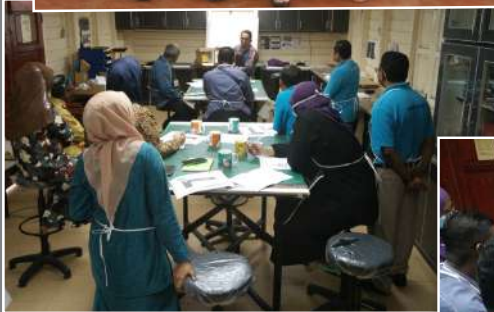
Peserta diberikan penerangan mengenai kotak simpanan dan sokongan artifak