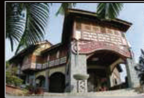
MUZIUM SUNGAI LEMBING, PAHANG