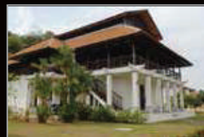
MUZIUM LUKUT, NEGERI SEMBILAN