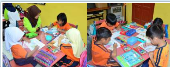
Pertandingan mewarna kanak-kanak tadika