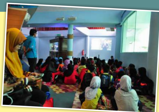
Peserta menonton tayangan video Kerajaan-kerajaan Melayu Awal