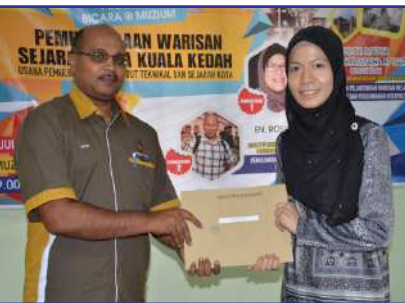
Sesi penyampaian sijil penyertaan oleh Ketua Muzium Kota Kuala Kedah