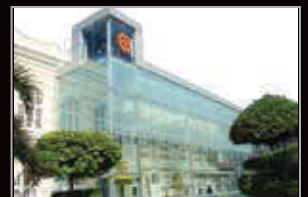
MUZIUM TEKSTIL NEGARA, KUALA LUMPUR