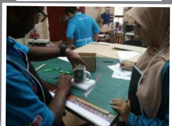
Proses mengambil ukuran foam

Pada 9 Mei 2019, Muzium Perak telah mengadakan aktiviti pencambahan minda "Bengkel membuat kotak dan sokongan artifak" bertempat di Makmal Konservasi, Muzium Perak. Pengurusan koleksi merupakan wadah yang sangat penting dalam pengurusan sesebuah muzium dan ia mampu memberikan identiti dan populariti kepada kewujudan muzium. Muzium Perak merupakan antara muzium yang terawal di Asia Tenggara dan sudah semestinya ia menyimpan koleksi khazanah negara yang sangat berharga.