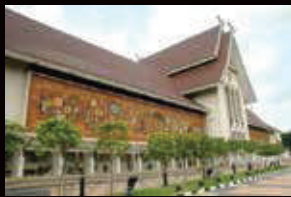
MUZIUM NEGARA KUALA LUMPUR