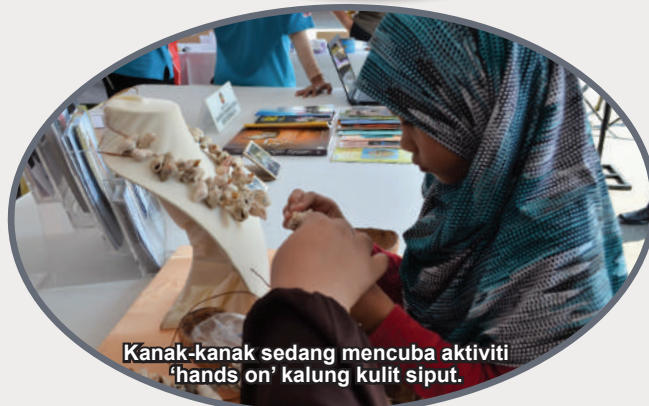
Kanak-kanak sedang mencuba aktiviti 'hands on' kalung kulit siput.