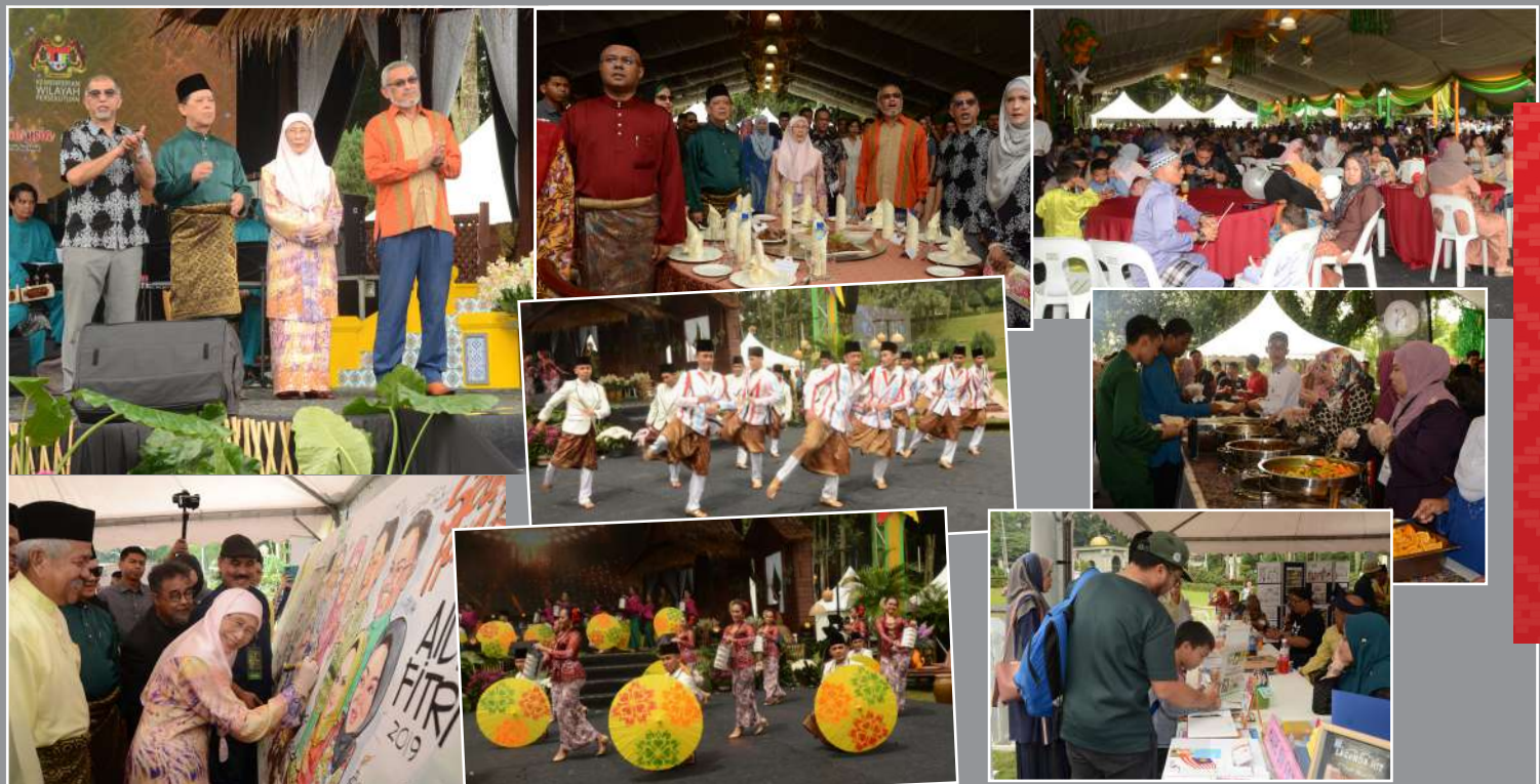
Majlis Raya MRTM di MDR