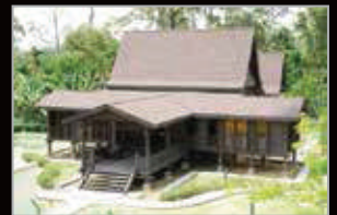
MUZIUM KOTA JOHOR LAMA, JOHOR