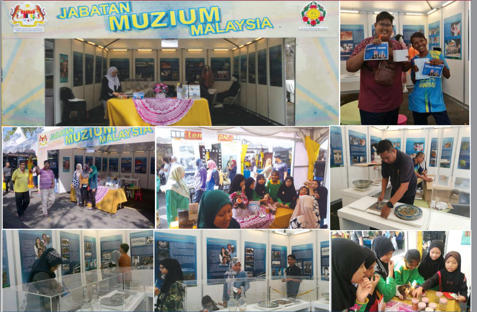
Pesta Balik Pulau