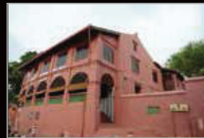
MUZIUM SENI BINA MALAYSIA, BANDAR HILIR, MELAKA