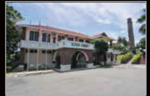
MUZIUM CHIMNEY, LABUAN