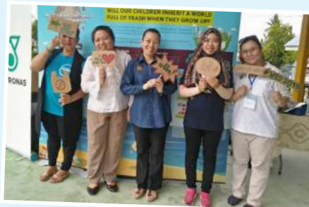
Pameran daripada jabatan/agensi yang terlibat menayakan Program World Oceans Day 2019