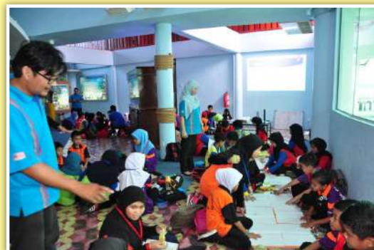
Aktiviti merentas samudera

peserta yang ditemubual menyatakan program ini merupakan sebuah program yang amat baik dengan pelbagai kaedah pendekatan belajar sejarah yang mampu menarik minat murid melalui pelbagai aktiviti berkonsepkan bermain sambil belajar. Mereka berharap program ini akan dapat diteruskan oleh pihak muzium pada masa akan datang. Program telah bermula dan berakhir di Muzium Chimney.