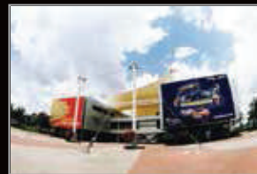
MUZIUM AUTOMOBIL NASIONAL, SEPANG