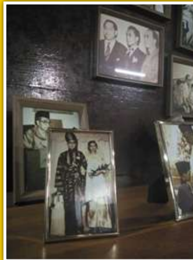
Sebahagian potret peribadi Tun Abdul Razak

Terowong Bawah Tanah atau “Pengkang” dikorek secara manual tanpa menggunakan bahan letupan. Sebelum kerja melombong dijalankan ahli-ahli kaji bumi terlebih dahulu mengkaji kedudukan longgokan bijih timah. Kajian dilakukan secara berterusan bagi memastikan perlombongan terus beroperasi. Terowong terdalam adalah lombong niyah. Lombong ini terletak 700 meter ke bawah dasar bumi manakala Lombong Tabeto pula mencecah 500 meter ke dasar bumi.