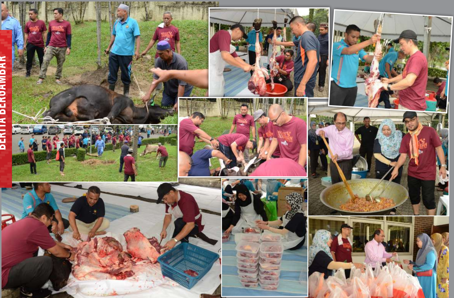
Program Ibadah Qurban dan Aqiqah 1440H