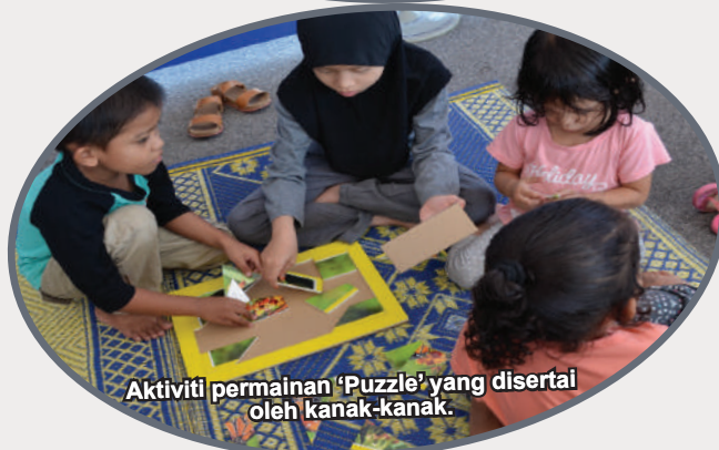
Aktiviti permainan 'Puzzle' yang disertai oleh kanak-kanak.

Program Karnival Lenggong 2019 merupakan satu program tahunan yang dianjurkan oleh Jabatan Warisan Negara dengan kerjasama pelbagai pihak antaranya ialah Kerajaan Negeri Perak, agensi-agensi di bawah Kementerian Pelancongan, Seni dan Budaya Malaysia serta Pihak Berkuasa Tempatan. Program Karnival Lenggong 2019 ini telah berlangsung dengan jayanya pada 12 dan 13 Julai 2019 bertempat di Dataran Lenggong, Perak. Program ini telah dirasmikan oleh YBrs. Puan Saraya binti Arbi iaitu Timbalan Ketua Setiausaha (Kebudayaan), MOTAC yang mewakili YB Menteri. Program ini turut dihadiri oleh Y.B. Encik Abdul Yunus Bin Jamahri iaitu Pengerusi Jawatankuasa Kemudahan Awam, Infrastruktur, Pertanian dan Perladangan yang mewakili YB Menteri Besar Negeri Perak, YBrs. Encik Mohamad Muda bin Bahadin, Timbalan Ketua Pengarah Jabatan Warisan Negara dan YBrs. Encik Mohamad Shawali Bin Hj. Badi, Timbalan Ketua Pengarah, Bahagian Dasar, Jabatan Muzium Malaysia. Program ini diadakan bersempena sambutan ulang tahun pengiktirafan Lembah Lenggong sebagai Tapak Warisan UNESCO pada 30 Jun 2012.