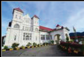
MUZIUM PERAK TAIPING PERAK