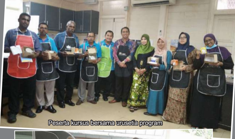
Peserta kursus bersama urusetia program

Oleh : Nor Aini binti Hassan, Muzium Perak