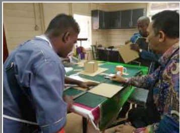
Proses membuat lakaran pada kotak