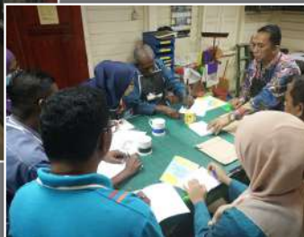
Proses pengecaman dan cara mengambil ukuran artifak