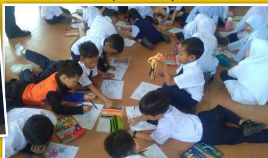
Aktiviti mewarna tahap satu