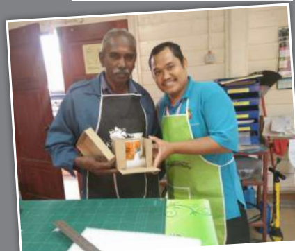
Kotak yang telah siap