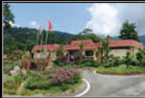
MUZIUM ARKEOLOGI LEMBAH BUJANG, KEDAH