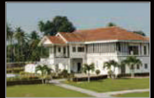
MUZIUM MATANG, PERAK