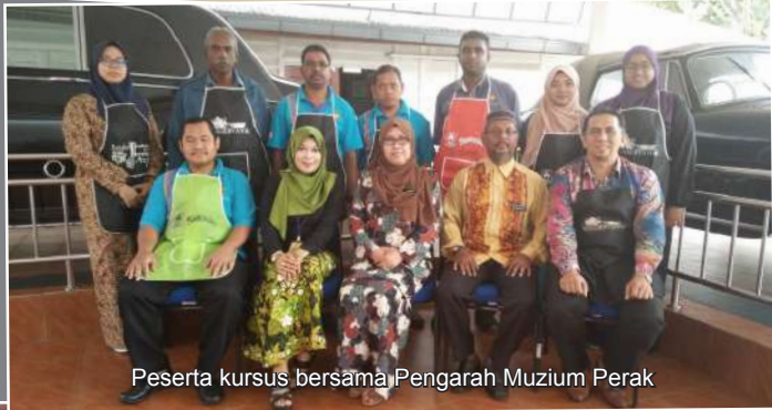
Peserta kursus bersama Pengarah Muzium Perak