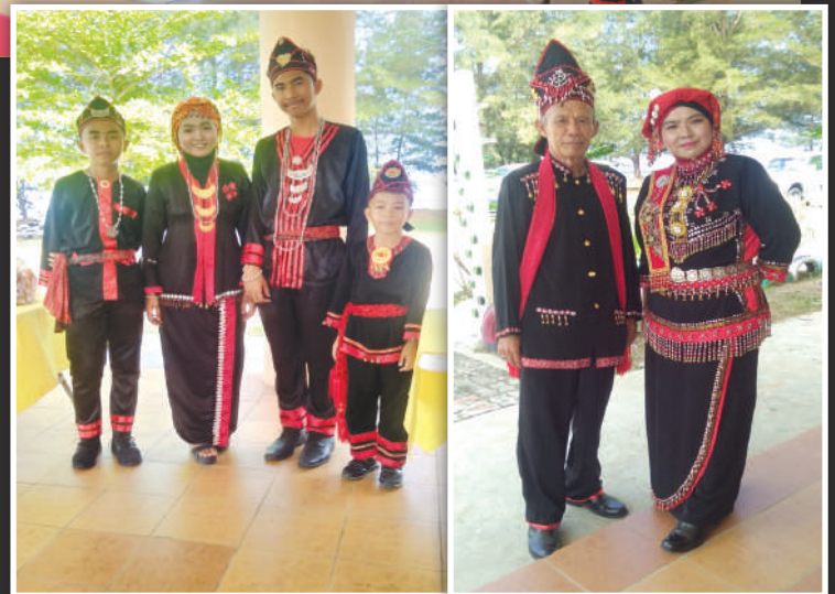
Kanan -Busana tradisi Kedayan. Baju Butang Tipai (Lelaki), Baju Basuja Bakubamban (Perempuan), Kiri – Anak-Anak Kedayan

Dalam Bamukun penjagaan adab dan tertib pergaulan teruna-dara jelas dititikberatkan dengan menempatkan kedudukan Sih Gendang (dara) di sebalik tabir atau tirai yang menjadi penghadang atau had kepada Si Penandak (teruna). Secara asasnya si dara akan berada di sebalik tabir sambil memukul gendang dan menjual pantun-pantun kepada Teruna Pengayau yang datang bertandang. Sementara Teruna Pengayau yang berani masuk ke gelanggang Bamukun dengan tujuan mencari calon isteri akan menjual beli pantun atau bertandak sehabis baik agar dapat memikat hati si dara di balik tabir pemisah. Dengan langkah diatur, si Penandak kelihatan segak