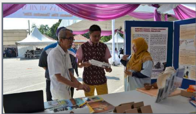
Pegawai Muzium Perak Taiping sedang memberi penerangan tentang konsep Inspirasi Pelajar Inovasi Muzium (IPIM)