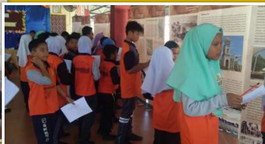
Aktiviti menjawab kuiz sejarah Labuan