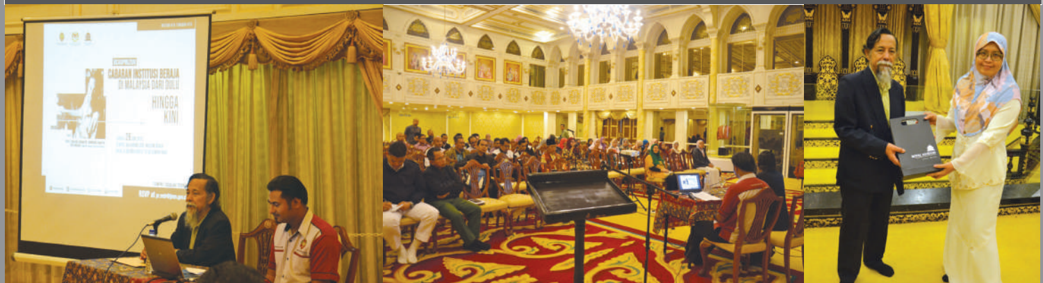
Cabaran institusi beraja di Malaysia dari dulu hingga kini