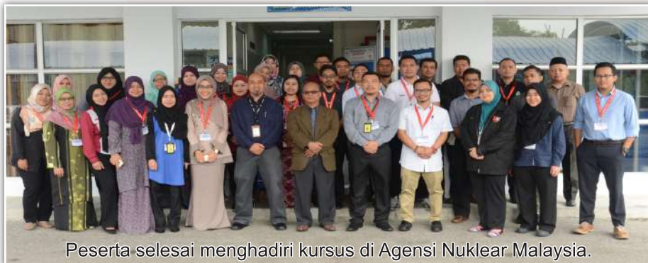
Peserta selesai menghadiri kursus di Agensi Nuklear Malaysia.

Kursus dua hari yang singkat dan padat ini dapat memberikan pendedahan secara teori dan praktikal kepada semua peserta yang terlibat. Hal ini dapat membuka minda ke semua peserta bahawa konservasi bukan hanya menjalankan aktiviti restorasi dan kuratif tetapi lebih daripada itu. Proses konservasi perlu dijalankan secara teliti dengan memahami pencirian, asal usul, keaslian dan analisis elemen bagi setiap artifak. Pendedahan yang diberikan dalam kursus ini telah memberikan impak yang besar berdasarkan teknik dan teknologi yang lebih canggih dan juga cara pemikiran orang awam berkenaan Agensi Nuklear Malaysia. Hal ini kerana, ramai yang rasa takut dan gusar apabila perkataan 'Nuklear' digunakan. Nuklear sering digambarkan sebagai perkara yang memberi impak yang negatif seperti kesan radiasi dan mutasi. Namun begitu, kursus ini telah menukar pemikiran peserta dan memberikan fakta yang menarik bahawa nuklear sebenarnya memberikan kesan yang positif dan tidak menakutkan malahan penting dalam aplikasi teknik konservasi pada masa hadapan kelak.