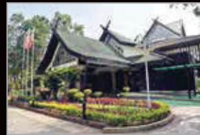
GALERIA PERDANA, LANGKAWI