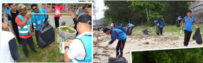
Menimbang berat bahan kitar semula mengikut kategori iaitu plastik, kaca, aluminium dan lain-lain