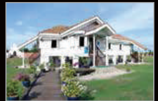
MUZIUM KOTA KUALA KEDAH, KEDAH