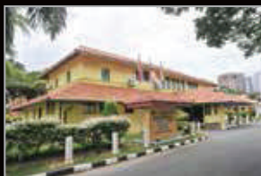
MUZIUM LABUAN, LABUAN