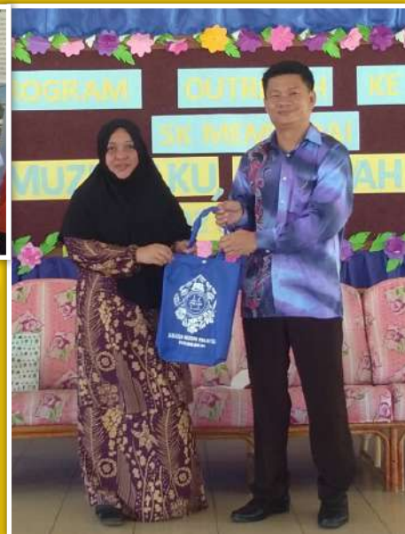
Penyampaian cenderamata penghargaan kepada pihak sekolah