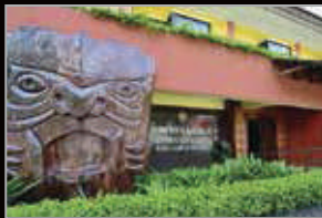
MUZIUM SENI KRAF ORANG ASLI, KUALA LUMPUR