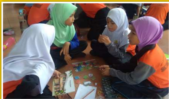
Aktiviti Permainan Eksplorasi Muzium dan Sejarah menerapkan konsep bermain sambil belajar sejarah bagi murid-murid darjah empat

Program setengah hari yang telah dianjurkan ini secara keseluruhannya dilihat sedikit sebanyak berjaya menarik minat para guru dan murid-murid bagi mendekati pihak muzium melalui pelbagai aktiviti pengisian yang telah dijalankan. Selain itu program ini dapat menjadi landasan terbaik ke arah mewujudkan hubungan rapat di antara muzium, murid dan sekolah untuk mengenali dengan lebih mendalam tentang sejarah dengan melihat serta memahami apa yang dipamerkan di muzium. Pihak Jabatan Muzium Malaysia Wilayah Labuan berharap kerjasama ini akan dapat dikekalkan kerana penglibatan serentak muzium, murid dan guru boleh meningkatkan minat murid untuk meneroka pengetahuan baharu melalui interaksi secara langsung dengan bahan pameran mahupun aktiviti yang telah disediakan.