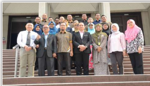
Peserta kursus bersama Timbalan Ketua Pengarah Dasar