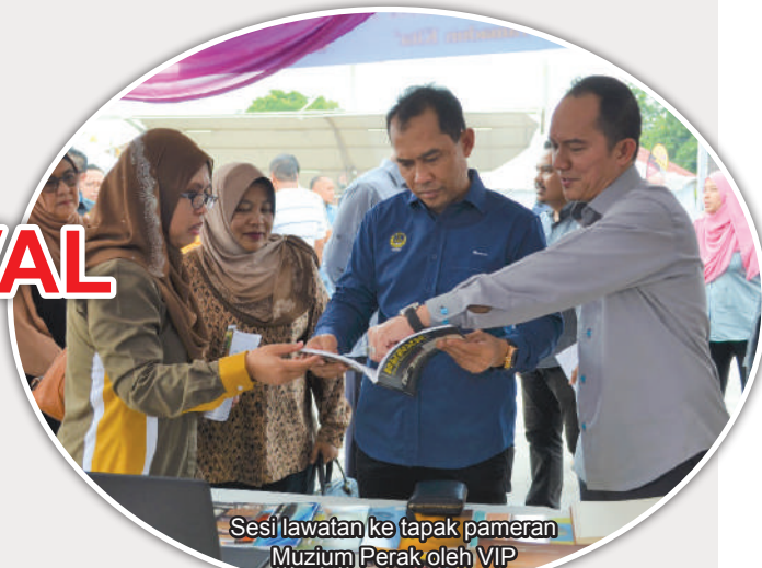
Sesi lawatan ke tapak pameran Muzium Perak oleh VIP