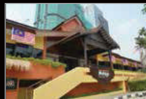
MUZIUM ETNOLOGI DUNIA MELAYU, KUALA LUMPUR