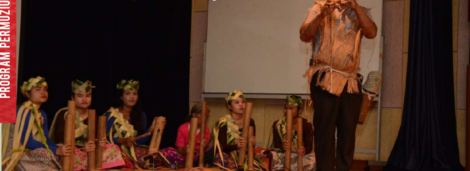
Alunan tiupan pensol dan permainan alat muzik buluh centong oleh Kumpulan Bah Bola, Suku Kaum Semai, Pahang sebelum majlis perasmian bermula.

Pada tahun ini, Muzium Seni Kraf Orang Asli (MSKOA) sekali lagi meneruskan penganjuran satu program wacana ilmu yang dinamakan Program Bicara@Muzium 2019 dan pihak Muzium Seni Kraf Orang Asli (MSKOA) telah memilih satu tajuk khusus untuk program ini iaitu Keaslian Orang Asli: Menjejak Asal Usul Leluhurnya yang memberi fokus kepada DNA dan Genetik, Bahasa dan Linguistik Orang Asli. Program bicara ini juga yang telah dimasukkan dalam Kalendar Tahun 2019 Jabatan Muzium Malaysia (JMM).