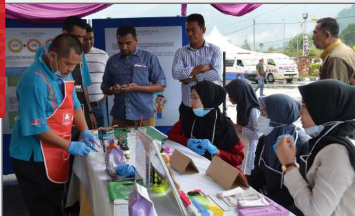
Staf Muzium Perak sedang membuat demonstrasi teknik pembuatan peracuan kepada pengunjung yang melawat ke tapak pameran

Oleh: Zairul Hida binti Hamdan, Muzium Perak Taiping