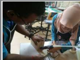
Proses meletakkan gam