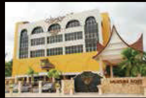
MUZIUM ADAT JELEBU, NEGERI SEMBILAN