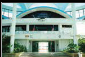
MUZIUM MARIN LABUAN, LABUAN