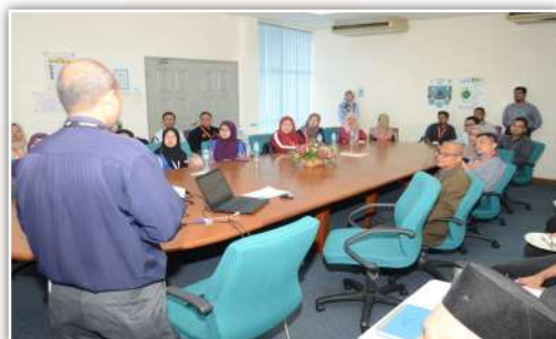
Taklimat sebelum lawatan bermula di Agensi Nuklear Malaysia

Pada 6 dan 7 Ogos yang lepas telah diadakan satu kursus aplikasi sains dalam pemuliharaan artifak yang dirangka oleh Bahagian Pengurusan Konservasi dibawah kelolaan Unit Pembangunan Modal Insan, Jabatan Muzium Malaysia (JMM) dengan kerjasama Agensi Nuklear Malaysia (ANM). Kursus ini mempunyai objektif dalam memberikan pendedahan asas kepada para peserta berkenaan teknik dan aplikasi yang digunakan oleh ANM dalam pemuliharaan artifak. Antara pendekatan nuklear yang digunakan adalah penyimpanan bahan, penilaian bahan artifak, pemeliharaan artifak, pencirian bahan yang merangkumi analisis unsur, analisis struktur, pencirian partikel dan analisis haba, perlindungan artifak serta laporan analisis struktur dan bahan. Antara alatan yang digunakan adalah Scanning Electron Microscopy (SEM) , X-Ray Fluorescence (XRF) dan juga X-ray Diffraction (XRD) .