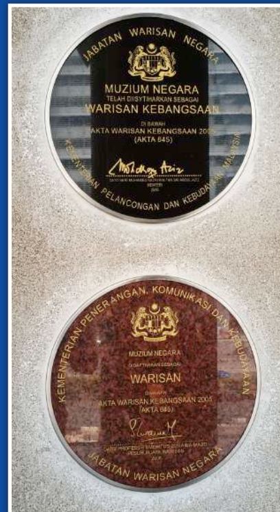
Plak Warisan Kebangsaan dan plak Warisan

Sebelum pengisytiharan Warisan Kebangsaan diumumkan, Muzium Negara telah diangkat sebagai Warisan pada 4 April 1996 dengan no. warta P.U. (A) 152. Ia merupakan satu pengiktirafan yang diberikan oleh Jabatan Warisan Negara kepada bangunan-bangunan atau monumen yang telah diangkat menjadi Warisan dan plak tersebut ditandatangani oleh Pesuruhjaya Warisan. Menurut Akta Warisan Negara pada seksyen 67 (1) Menteri boleh, melalui perintah yang disiarkan dalam Warta, mengisytiharkan mana-mana tapak warisan, objek warisan, warisan kebudayaan di bawah air yang disenaraikan dalam Daftar atau mana-mana orang yang hidup sebagai suatu Warisan Kebangsaan.