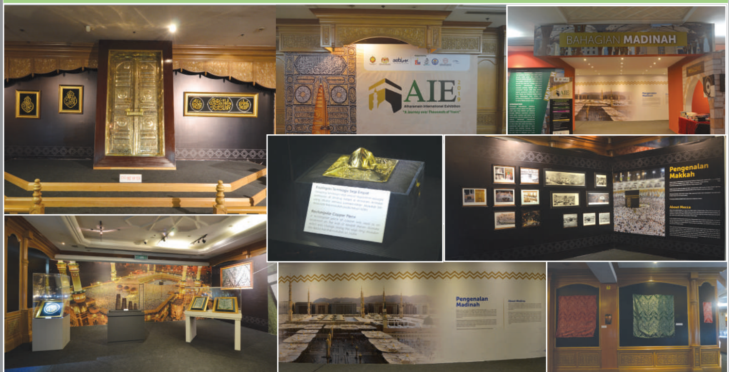
Pameran Antarabangsa Alharamain