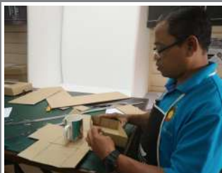
Proses membentuk kotak