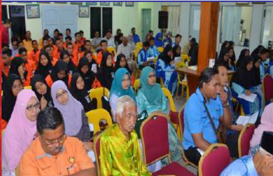
Para peserta yang menghadiri program Bicara @ Muzium: Pemuliharaan Warisan Sejarah Kota Kuala Kedah: “Usaha Pemuliharaan Dari Sudut Teknikal Dan Sejarah Kota”