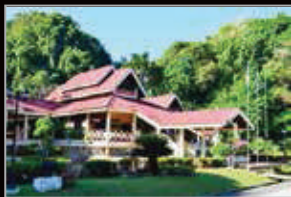
MUZIUM KOTA KAYANG, PERLIS