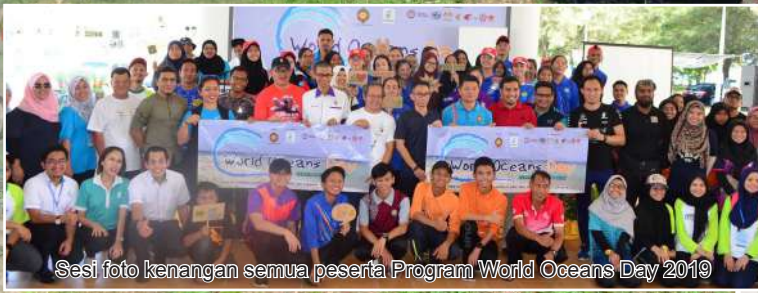
Sesi foto kenangan semua peserta Program World Oceans Day 2019