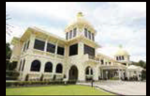
MUZIUM DIRAJA KUALA LUMPUR