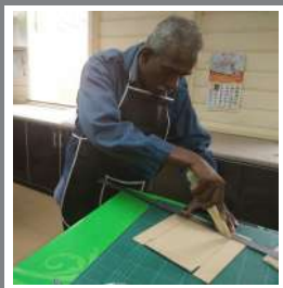
Proses memotong kepingan kotak