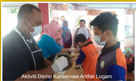
Aktiviti Demo Konservasi Artifak Logam