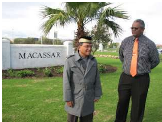
Wakil Presiden Indonesia Jusuf Kalla melawat Macassar