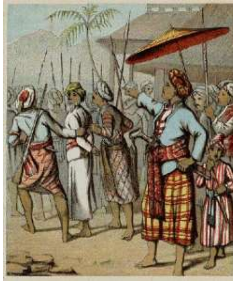
Pemimpin anti-kolonial Melayu (Gambar hiasan)