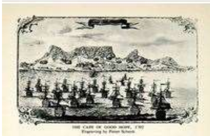
Kaapstad dari Laut

Seterusnya, dalam perkembangan sejarah mulai 1667 ramai pejuang anti-kolonial Belanda di Hindia Timur yang ditangkap dan dibuang ke Kaapstad. Umumnya mereka adalah orang bangsawan dan pemimpin agama Islam yang berpengaruh. Di tempat baharu itu mereka diasingkan