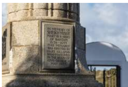
Nama Sheikh Yusuf terukir di menara berhampiran makam, 1925

Di Zandvleit makamnya segera menjadi tempat keramat yang sering diziarahi oleh masyarakat Melayu Cape dan orang Islam lainnya hingga kini. Mulai tahun 1940a sekitar 200 meter di depan kompleks