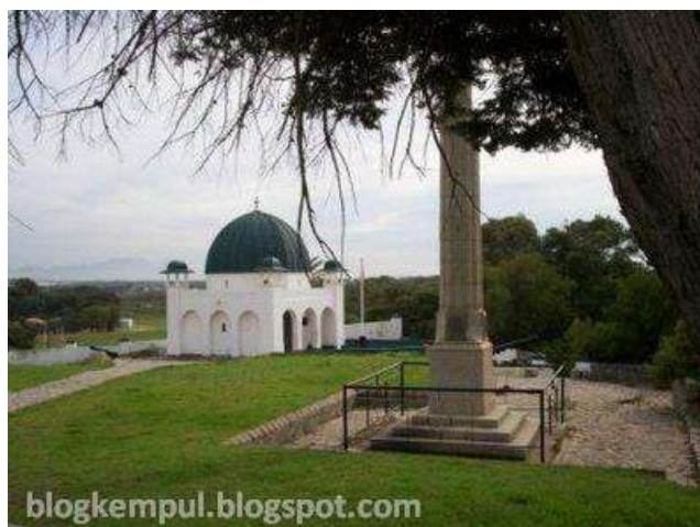
Makam Sheikh Yusuf di Zandvleit