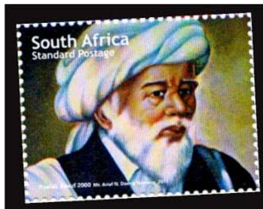
Setem berwajah Sheikh Yusuf