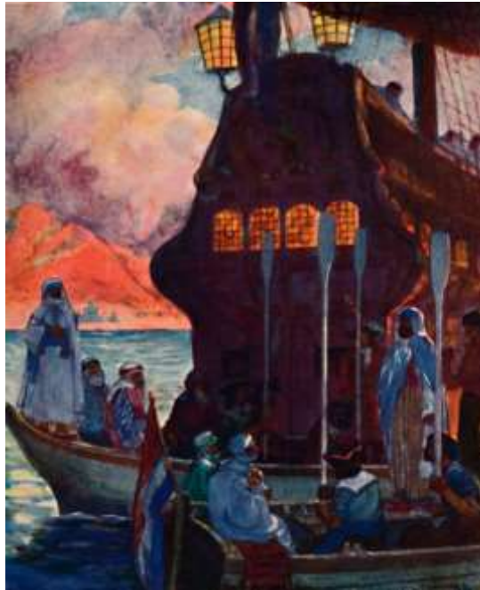
Shaikh Yusuf turun dari 'Flyt de Voetboog'

pengikutnya, termasuk 12 orang imam. Di sana beliau dan keluarga serta pengikutnya segera diasingkan ke ladang anggor Zandvleit di kuala Sungai Eerste yang jauhnya sekitar 35 kilometer dari pusat kota Kaapstad. Hasrat Belanda ialah agar Sheikh Yusuf tidak lagi mengenakan pengaruhnya ke atas komuniti Melayu yang sedia ada dan golongan hamba abdi umumnya.