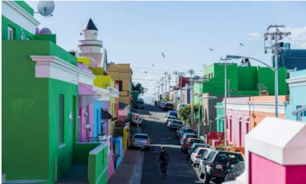
Bo-Kaap di Kaapstad