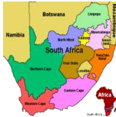
Peta Memperlihatkan Hindia Timur dan Afrika Selatan