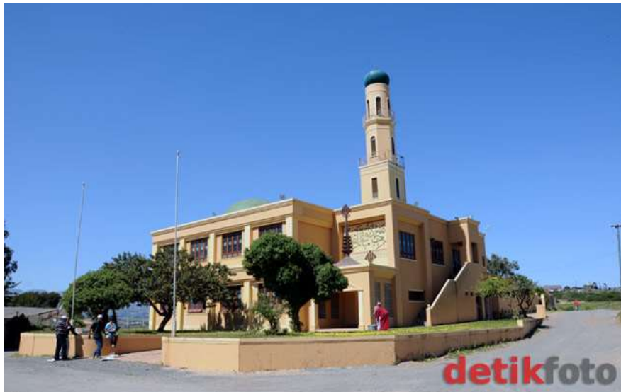
Masjid Nurul Latief

makamnya telah didirikan sebuah masjid yang diberi nama Masjid Nurul Latief.