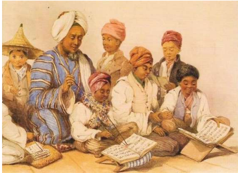
Keluarga Melayu Cape

Ajaran dan perjuangan Sheikh Yusuf meninggalkan kesan yang berpanjangan, bukan sahaja di Zandvleit, malah di Afrika Selatan seluruhnya. Kehadiran anak cucu beliau, bersama dengan anak cucu Orang Cayen lainnya, telah membolehkan pembangunan Bo-Kaap, satu kawasan yang unik yang mul dibangunkan pada sekitar 1760an di Signal Hill, Kaapstad sendiri. Bo-Kaap sesungguhnya ialah Malay Quarter atau Pekan Melayu yang menarik kerana jalannya yang agak sempit, yang asalnya dibuat dari susunan batu, dengan rumah-rumah yang indah dan berwarna-warni. Bo-Kaap juga memainkan peranan yang amat penting dalam proses kemasukan Islam ke Kaapstad atau Cape Town. Masjid yang terawal di Bo-Kaap ialah Masjid Auwal yang masih dapa dilihat di Dorp Street.