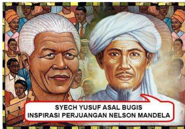
Shaikh Yusuf sumber inspirasi Nelson Mandela