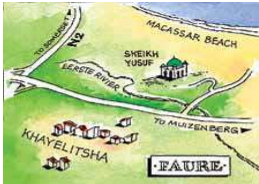
Lakaran peta Macassar