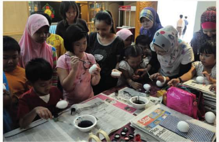
▲ Para peserta sedang membuat kepala boneka.