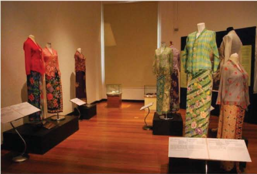
▲Keindahan Kebaya Nyonya diperagakan dalam Pameran Kebaya Tales.

Kebaya Nyonya amat sinonim dalam kalangan Nyonya Melaka dan Pulau Pinang. Kebaya merujuk kepada pakaian tradisional yang dipakai oleh wanita Indonesia dan Malaysia. Pakaian ini diperbuat daripada kain kasa yang dipakai dengan sarung, batik atau pakaian tradisional yang lain seperti songket dengan motif warna-warni. Kebaya Nyonya diciptakan pertama kali oleh orangperanakan Melaka. Kini, Kebaya Nyonya sedang mengalami pembaharuan, dan juga terkenal dalam kalangan wanita bukan Asia.