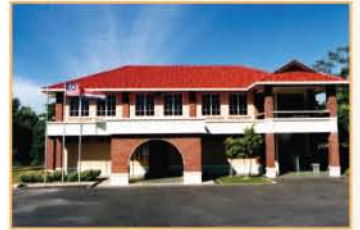
MUZIUM CHIMNEY, LABUAN