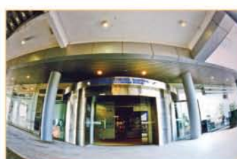
MUZIUM AUTOMOBIL NASIONAL, SEPANG