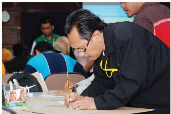
▼ Peserta sedang mengaplikasi teknik konservasi artifak yang telah dipelajari.