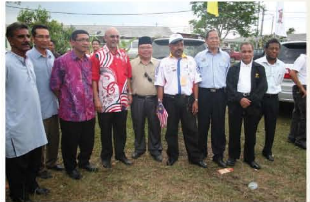
▲ YB Senator bergambar bersama-sama wakil MSBM dan penduduk tempatan.