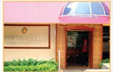
MUZIUM SENI KRAF ORANG ASLI, KUALA LUMPUR