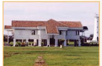
MUZIUM KOTA KUALA KEDAH, KEDAH