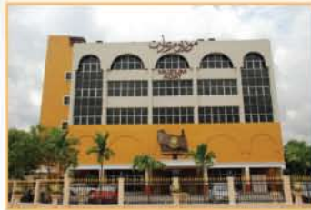
MUZIUM ADAT, JELEBU, NEGERI SEMBILAN