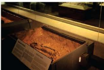
Galeri A : Sejarah Awal