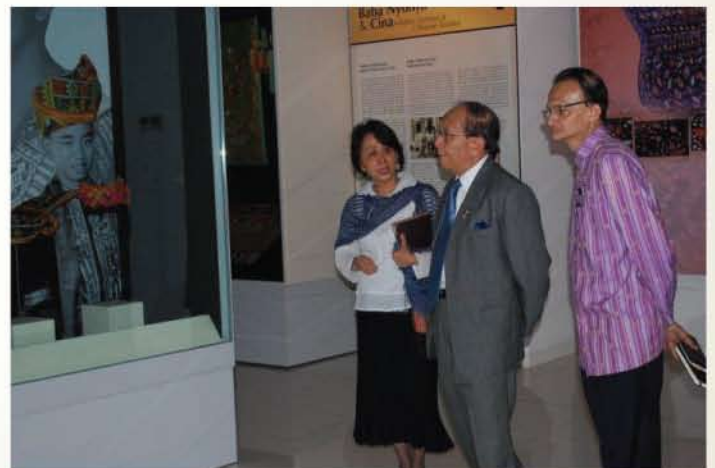
▲ Pengarah Muzium Tekstil Negara memberikan penerangan kepada YB Menteri.

Pelbagai idea, cadangan dan halatuju muzium dibincangkan dalam lawatan ini. Lawatan YB Menteri Penerangan, Komunikasi dan Kebudayaan ini jelas menggambarkan keprihatinan dan minat beliau terhadap aspek sejarah dan budaya khususnya tekstil negara.