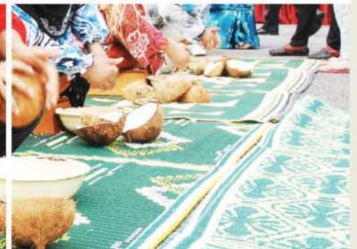
▲ Antara aktiviti yang dijalankan bagi memeriahkan Program Jom Santai Bersama Media @ Muzium Perak