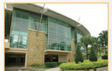
MUZIUM ALAM SEMULA JADI, PUTRAJAYA