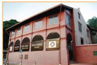
MUZIUM SENI BINA MALAYSIA, BANDAR HILIR, MELAKA