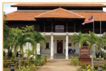
MUZIUM LUKUT, NEGERI SEMBILAN