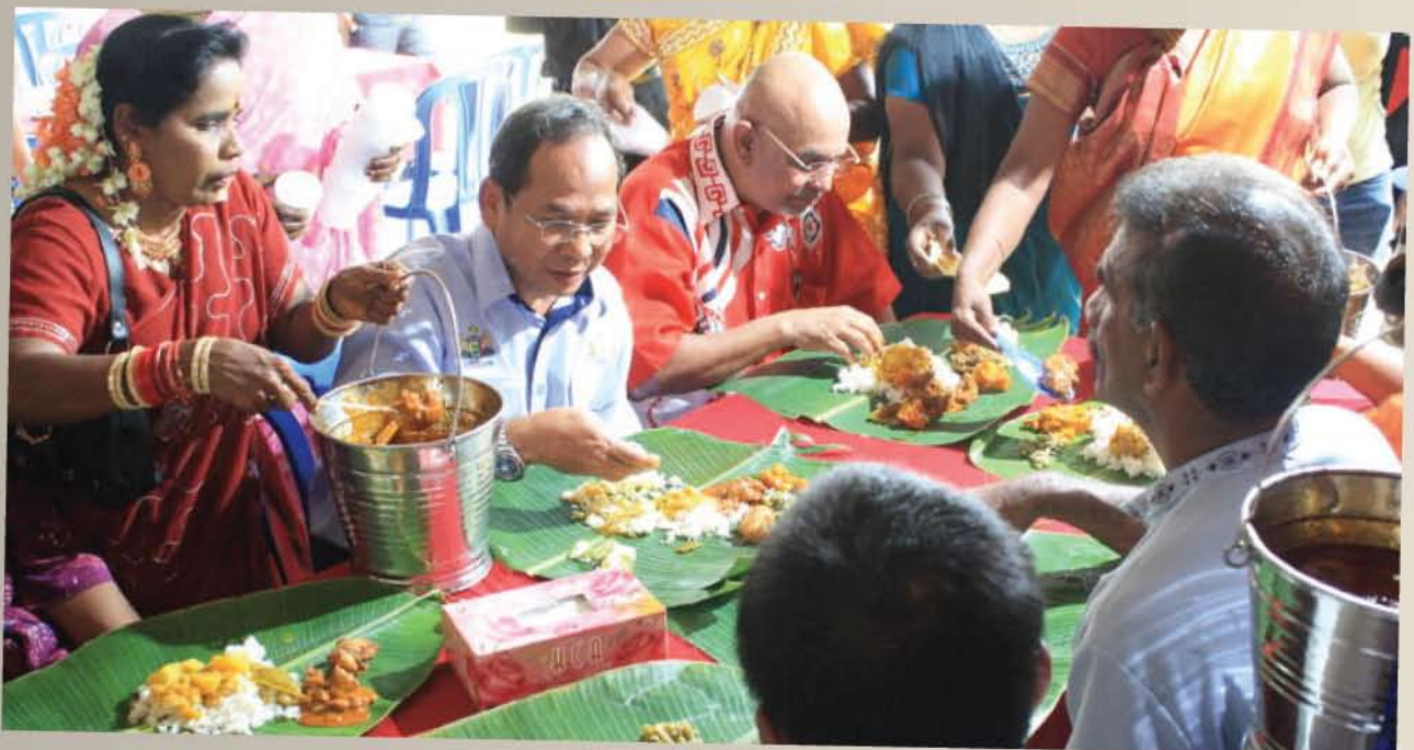
▲ YB Senator Datuk Maglin Dennis D'Cruz, Timbalan Menteri Penerangan, Komunikasi dan Kebudayaan bersama-sama masyarakat tempatan menikmati nasi daun pisang.