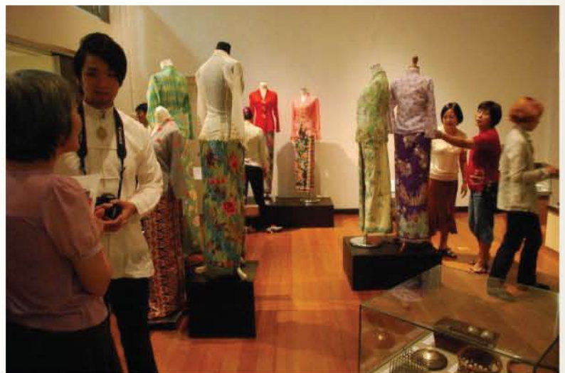
▲Pengunjung sedang melihat keunikan seni sulaman Kebaya Nyonya.

Dengan objektif mengembalikan nostalgia masyarakat kepada keindahan Kebaya Nyonya, Muzium Tekstil Negara telah mengambil inisiatif mengadakan Pameran Kebaya Tales di Galeri Saindera, Muzium Tekstil Negara mulai 8 Januari hingga 28 Februari 2011. Pameran ini mempamerkan pakaian Kebaya Nyonya bagi wanita Peranakan Cina dalam ideologinya yang tersendiri terutamanya dari sudut kepercayaan dan adat. Selain itu, dipaparkan juga keunikan seni sulaman dan kreativiti wanita Peranakan ini dalam seni jahitan. Koleksi yang dipamerkan merangkumi artifak dalam bidang seramik, peralatan dapur, perhiasan diri dan seni sulaman manik.