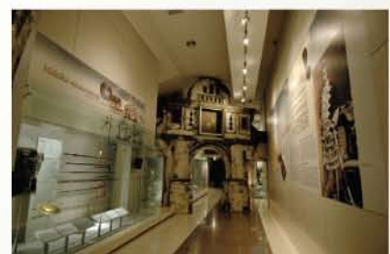
Galeri C : Era Kolonial