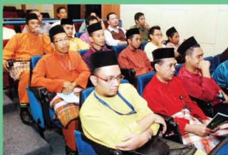
▲ Warga kerja JMM yang turut serta memeriahkan Majlis Ceramah Agama yang berlangsung di Auditorium JMM.

Majlis diteruskan lagi dengan ceramah agama yang bertajuk 'Integriti Rasulullah, Teladan Sepanjang Zaman' yang disampaikan oleh Ustaz Azhar bin Tuarni, iaitu Imam Masjid Negara yang dijemput khas.