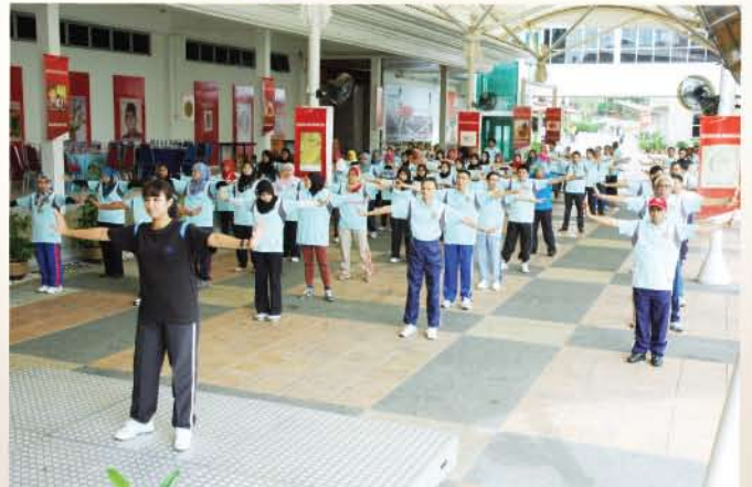
▲ Aktiviti senam seni di Dataran Muzium Negara pada 25 Januari 2011.