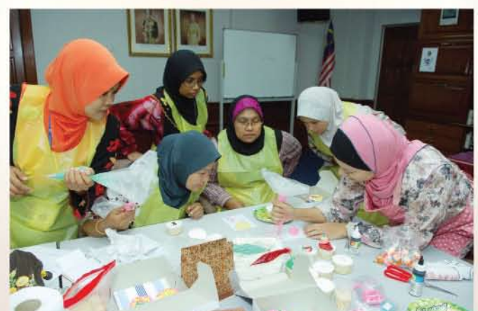
▲ Para peserta tekun mempelajari cara-cara menghias kek cawan ketika Kelas Dekorasi Kek Cawan anjuran Puspanita.