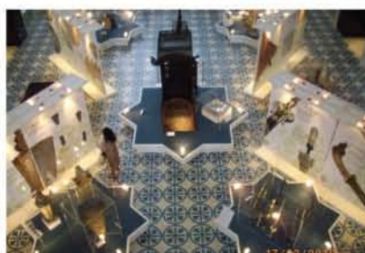
Lobi Muzium Negara