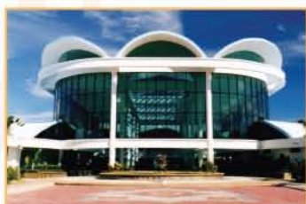
MUZIUM MARIN, LABUAN