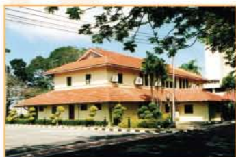
MUZIUM LABUAN, LABUAN