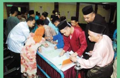
▲ Peserta perarakan Maulidur Rasul sedang mendaftar untuk sesi ceramah di meja urus setia.