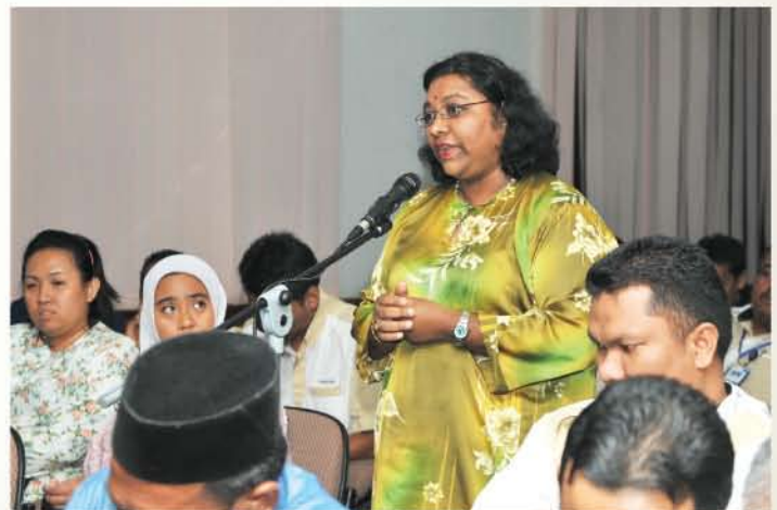
▲ Salah seorang Staf Sokongan 2 sedang mengutarakan soalan kepada Pengurusan Tertinggi JMM.