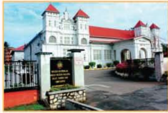
MUZIUM PERAK, TAIPING, PERAK