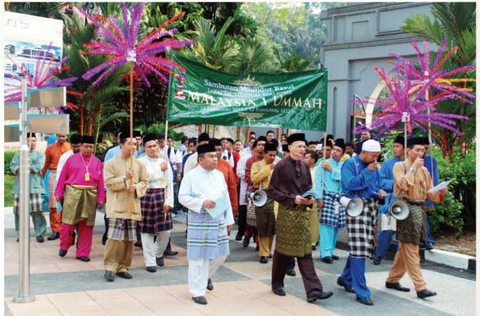
▲ Perarakan yang diketuai oleh Ketua Pengarah.

Pemilihan tema ini bertujuan menyeru seluruh umat Islam supaya bersatu dengan menyayangi agama, bangsa dan negara serta menanam azam bagi melahirkan satu ummah yang mampu membawa kedamaian dan keadilan berpaksikan kepada al-Quran dan Sunnah.