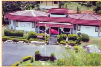
MUZIUM ARKEOLOGI LEMBAH BUJANG, KEDAH