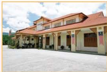
MUZIUM ARKEOLOGI LENGGONG, PERAK