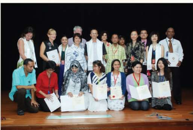
▲ Para graduan Sukarelawan Muzium bergambar bersama-sama Ketua Pengarah JMM di Majlis Graduasi pada 5 Mac 2011.