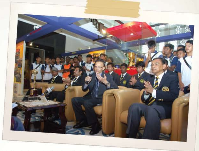
▲ YBhg. Dato' Ibrahim bin Ismail, Ketua Pengarah JMM bersama-sama dengan YBhg. Datuk Azzuddin Ahmad, Setiausaha Agung FAM semasa sidang media.

Sepanjang tempoh pameran ini diadakan di Muzium Negara, turut disediakan gerai menjual produk bola sepak seperti baju, jersi kebangsaan dan pelbagai cenderahati eksklusif. Pameran ini dibuka setiap hari Sabtu dan Ahad selama sebulan. Selain itu, pengunjung juga berpeluang menyertai beberapa aktiviti sampingan seperti permainan 'Play Station 3' dan gaya bebas bola sepak. Majlis pelancaran tersebut telah diadakan pada 29 Januari 2011 di Muzium Negara yang disempurnakan oleh Ketua Pengarah JMM, YBhg. Dato' Ibrahim bin Ismail. Turut hadir dalam majlis tersebut ialah Setiausaha Agung Persatuan Bola Sepak Malaysia (FAM), YBhg Datuk Azzuddin Ahmad, pengurus pasukan kebangsaan, YBhg Datuk Subahan Kamal dan jurulatih K. Rajagobal serta Pemain Pasukan Bola Sepak Negara.