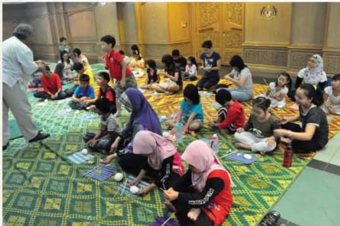
▲ Para peserta tekun menyiapkan boneka mereka.