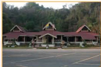
MUZIUM KOTA KAYANG, PERLIS