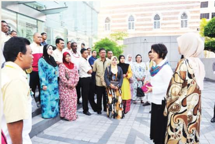
▲ Pengarah Muzium Tekstil Negara memberikan penerangan kepada Staf Sokongan 2.

Tujuan utama sesi perjumpaan ini diadakan adalah untuk mendapatkan maklum balas mengenai tugas-tugas yang dilaksanakan. Staf juga berpeluang untuk membangkitkan sebarang persoalan berkaitan tugas dan tanggungjawab yang diharapkan dapat diselesaikan oleh pihak pengurusan atasan jabatan. Di samping itu, sesi tersebut merupakan platform untuk mengeratkan silatur rahim antara staf dan pengurusan atasan. Hasil daripada sesi perjumpaan ini ialah masalah yang telah diutarakan oleh staf telah diselesaikan dengan segera.