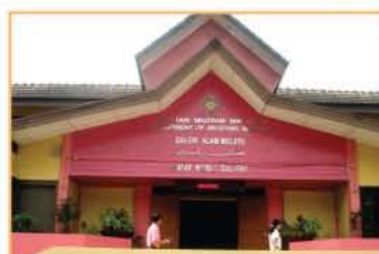
MUZIUM ETNOLOGI DUNIA MELAYU, KUALA LUMPUR