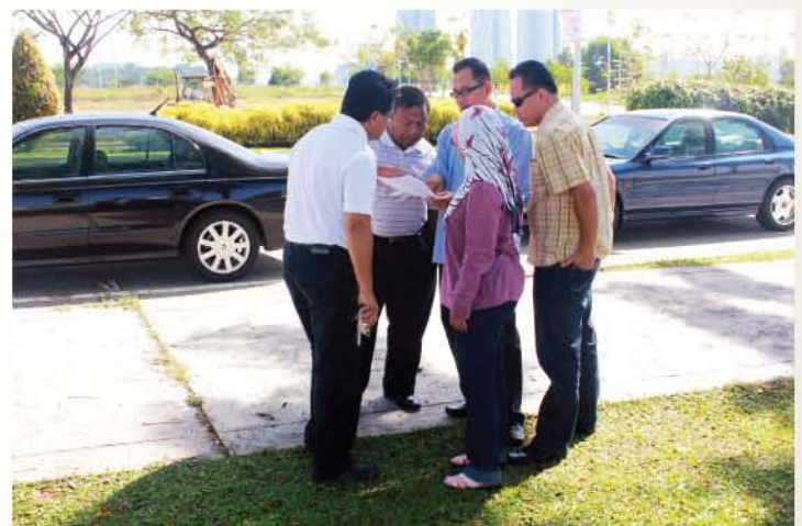
▲ Lawatan ke tapak cadangan penubuhan Muzium Alam Semula Jadi.