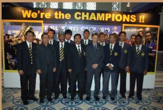
▲ Pameran Piala Suzuki AFF 2010 yang diadakan di Muzium Negara.