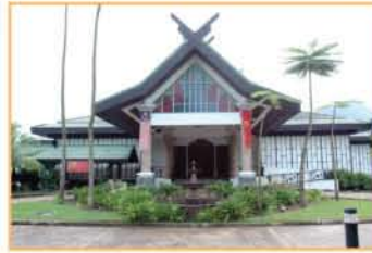
GALERIA PERDANA, LANGKAUI