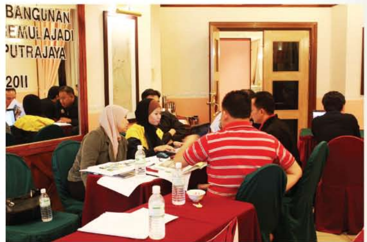
▲ Sesi perbincangan berkumpulan merupakan salah satu tentatif program pemukiman.

Pada hari terakhir pemukiman, satu lawatan ke tapak cadangan penubuhan Muzium Alam Semula Jadi di Presint 5 Putrajaya telah diadakan.