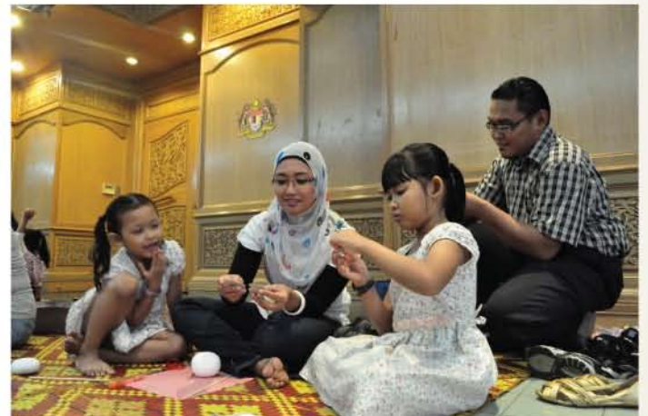
▲ Para peserta teruja menyiapkan boneka masing-masing.