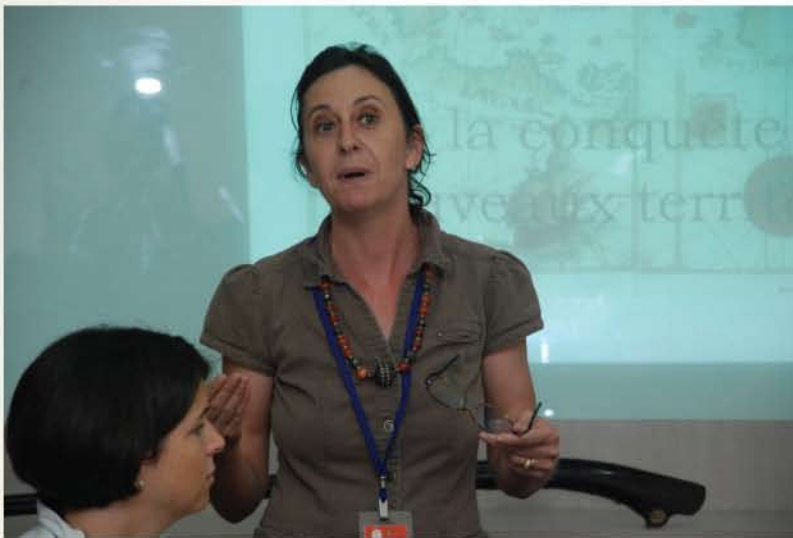
▲ Sukarelawan muzium memberikan pandangan terhadap program anjuran muzium.

Pada 5 Mac 2011, Majlis Graduasi Sukarelawan Muzium telah diadakan di Auditorium Jabatan Muzium Malaysia. Majlis ini bertujuan memberikan penghargaan dan pengiktirafan kepada 40 orang sukarelawan muzium atas komitmen mereka terhadap usaha memberikan kesedaran tentang kepentingan muzium sebagai institusi pembelajaran tidak formal, mempromosikan muzium dan menyemai semangat cinta akan negara. Majlis Graduasi ini telah disempurnakan oleh Ketua Pengarah Jabatan Muzium Malaysia, YBhg. Dato' Ibrahim bin Ismail dan turut dihadiri oleh 150 orang sukarelawan muzium.