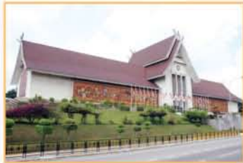
MUZIUM NEGARA, KUALA LUMPUR