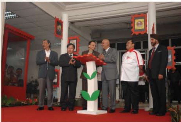
▲ YB Senator Datuk Maglin Dennis D'Cruz, Timbalan Menteri KPKK ketika merasmikan Pameran Setem 1Malaysia Satu Dunia.

Pameran ini terbahagi kepada tiga bahagian iaitu Jiwa Muda, Flora Fauna dan Kenali Dunia yang ditukar temanya setiap bulan. Sebagai contoh, jiwa muda memaparkan koleksi setem alat muzik dari seluruh dunia yang tidak pernah dijumpai di Malaysia, flora fauna pula mempamerkan alam semula jadi dan bunga seluruh dunia manakala kenali dunia pula mempamerkan adat budaya dan perayaan dunia.