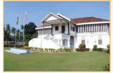
MUZIUM MATANG, PERAK