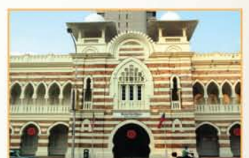
MUZIUM TEKSTIL NEGARA, KUALA LUMPUR