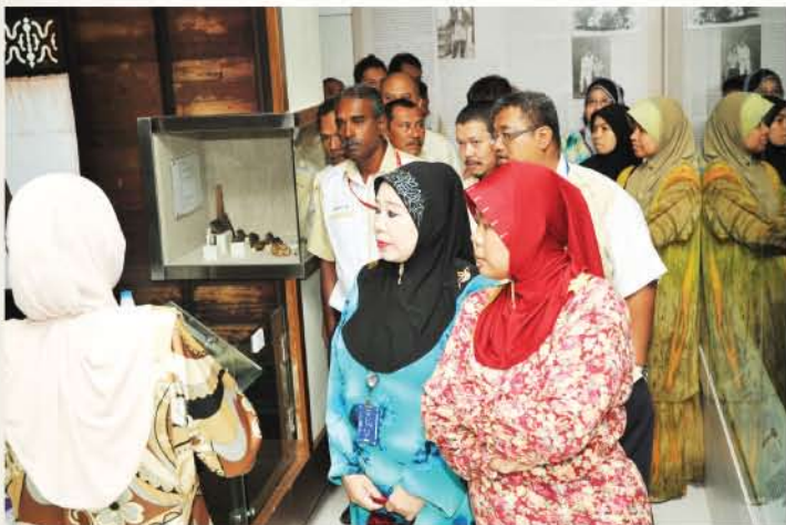
▲ Sesi lawatan Staf Sokongan 2 ke Muzium Tekstil Negara.