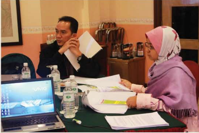
▲ Sesi sumbangsaran dilakukan sepanjang tempoh penganiuran Pemukiman Cadangan Pembangunan Muzium Alam Semula Jadi.

Cadangan penubuhan Muzium Alam Semula Jadi telah menjadi agenda perjuangan Jabatan Muzium Malaysia (JMM) sejak beberapa Rancangan Malaysia yang lepas. Penubuhan Muzium Alam Semula Jadi amat penting untuk membolehkan Malaysia memiliki sebuah muzium yang akan mempamerkan dan memulihara khazanah warisan alam semula jadi negara yang semakin diancam kepupusan.