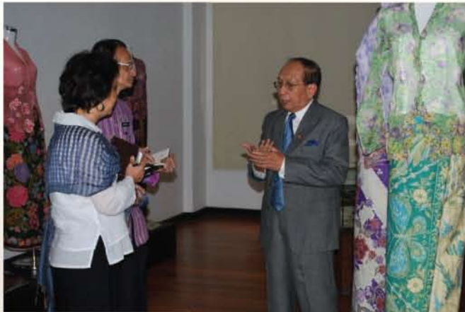
▲ YB Dato' Seri Utama Dr. Rais Yatim, Menteri Penerangan, Komunikasi dan Kebudayaan Malaysia memperkatakan sesuatu ketika lawatan beliau ke Muzium Tekstil Negara pada 17 Januari 2011.