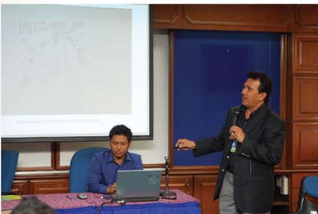
▼ Peserta kursus membentangkan kertas kerja pameran yang telah ditugaskan kepada setiap kumpulan.

Seramai lebih kurang 64 orang peserta telah menyertai kursus ini yang terdiri daripada kakitangan Jabatan Muzium Malaysia dan agensi lain.