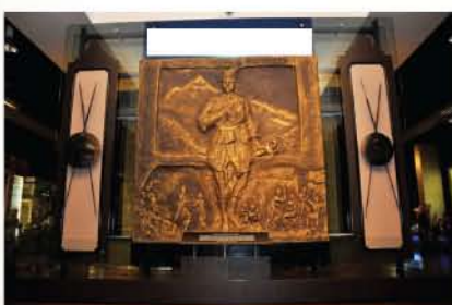
Galeri B: Kerajaan-kerajaan Melayu