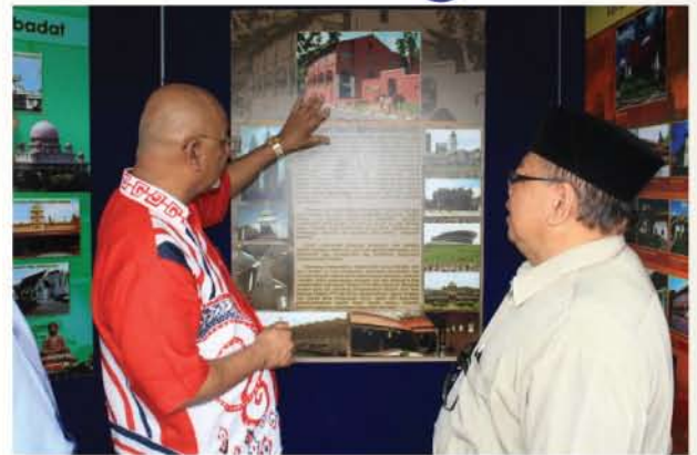
▲ YB Senator tertarik dengan pameran mengenai sejarah Muzium Seni Bina Malaysia.

Penglibatan masyarakat tempatan yang terdiri daripada orang Melayu, Cina dan India dalam program ini menggambarkan semangat 1Malaysia yang telah sebatikan dalam hati sanubari rakyat Malaysia. Menariknya, lebih 500 helai daun pisang yang digunakan sempena kenduri ini disumbangkan oleh penduduk. Majlis perasmian telah disempurnakan oleh Timbalan Menteri Penerangan, Komunikasi dan Kebudayaan Malaysia, YB Senator Datuk Maglin Dennis D'Cruz.