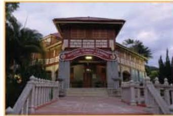
MUZIUM SUNGAI LEMBING, PAHANG