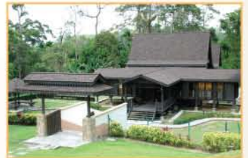
MUZIUM KOTA JOHOR LAMA, JOHOR