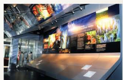
Galeri D : Malaysia Kini