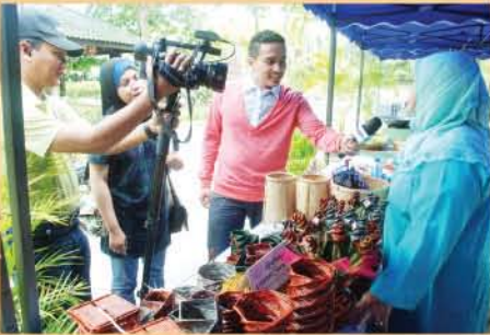
▲ Rakan media sedang menemu ramah penjual kraftangan di gerai Jom Santai.