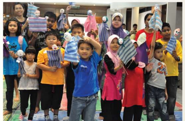
▲ Para peserta memperagakan boneka yang telah mereka hasilkan.