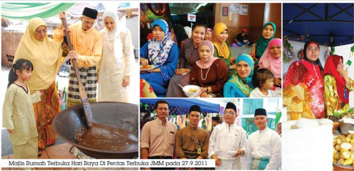
MaJlis Rumah Terbuka Hari Raya Di Pentas Terbuka JMM pada 27.9.2011