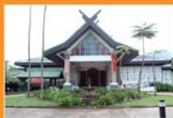
GALERIA PERDANA, LANGKAUI