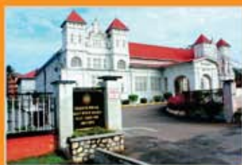
MUZIUM PERAK, TAIPING, PERAK