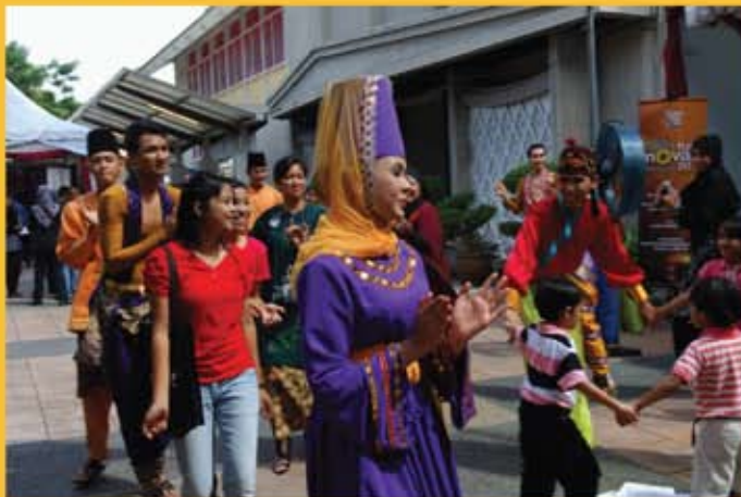
Persembahan kebudayaan dari Istana Budaya berjaya menarik perhatian para pengunjung yang berkunjung ke Majlis Sambutan Hari Inovasi KPKK.

Dianggarkan seramai 500 warga KPKK daripada 20 agensi yang bernaung di bawah KPKK menghadiri Sambutan Hari Inovasi dan memberikan sokongan kepada kumpulan KIK masing-masing yang telah diadakan di Auditorium JMM.