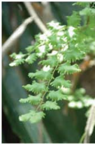
Pokok Ribu-ribu Kecil