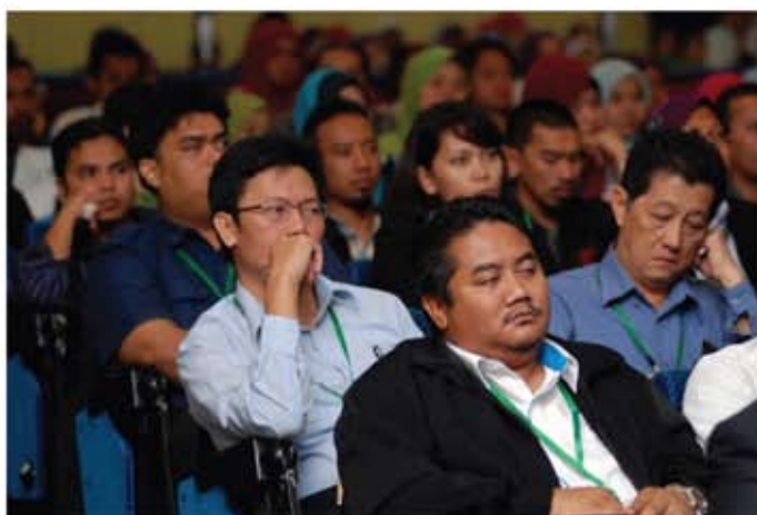
Jemputan yang hadir khusyuk mendengar pembentangan kumpulan-kumpulan yang mengambil bahagian dalam pertandingan KIK peringkat KPKK 2011.