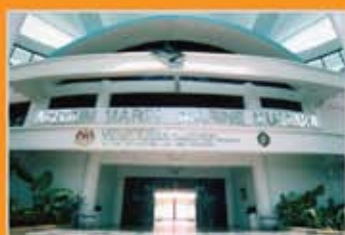
MUZIUM MARIN LABUAN, LABUAN