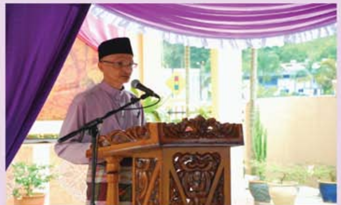
Ucapan perasmian YBhg. Dato' Ibrahim bin Ismail, Ketua Pengarah Jabatan Muzium Malaysia.

Bersesuaian dengan visi Jabatan Muzium Malaysia, Ke Arah Keunggulan Institusi Muzium dengan misi memainkan peranan penting dalam penyelidikan, program ini juga telah mencapai objektifnya, iaitu memberikan pengetahuan dan pengembangan ilmu kepada masyarakat. Melalui program ini telah didedahkan kepada masyarakat adat berkhatan yang telah mula dilupakan disebabkan oleh peredaran zaman.