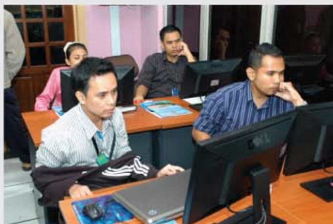
Peserta sedang membuat latihan yang diberikan.