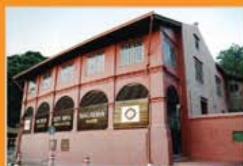
MUZIUM SENI BINA MALAYSIA, BANDAR HILIR, MELAKA