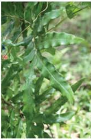
Pokok Ribu-ribu Besar