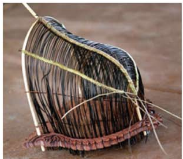
Serungkup sedang disiapakan menggunakan sulur pokok ribu-ribu. Ratan digunakan sebagai tulang belakang, manakala alasnya daripada kayu setol.