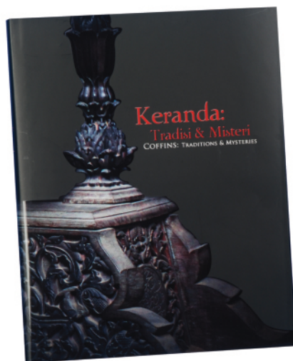
Judul : Keranda: Tradisi & Misteri Penerbit : Jabatan Muzium Malaysia / 2011