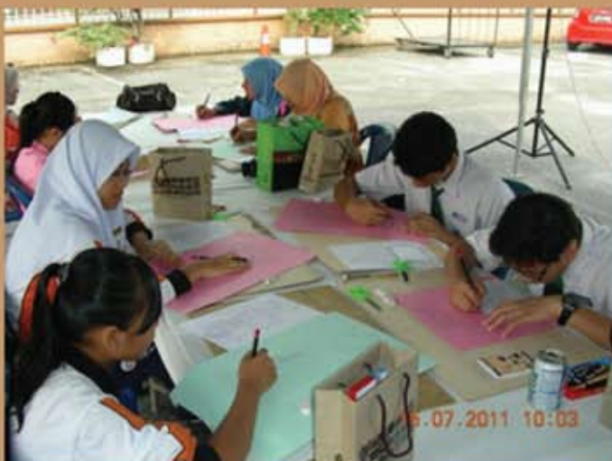
Para peserta sedang melakukan proses pertama dalam menghasilkan watak wayang kulit, iaitu melukis watak wayang kulit.

Dengan matlamat memberikan peluang kepada masyarakat untuk mempelajari proses pembuatan wayang kulit dari awal hingga akhir, Muzium Perak telah mengambil inisiatif menganjurkan Bengkel Membuat Wayang Kulit pada 15 Julai 2011. Ia juga dapat memberikan pendedahan yang lebih mendalam kepada masyarakat mengenai keunikan dan kekayaan warisan seni dan budaya masyarakat Melayu. Selain itu, bengkel ini juga bertujuan untuk menarik minat generasi muda dan menyebarkan maklumat kepada orang ramai.