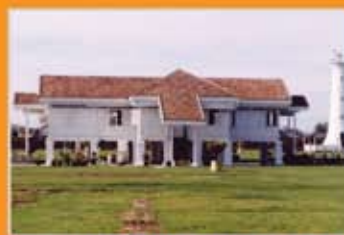
MUZIUM KOTA KUALA KEDAH, KEDAH