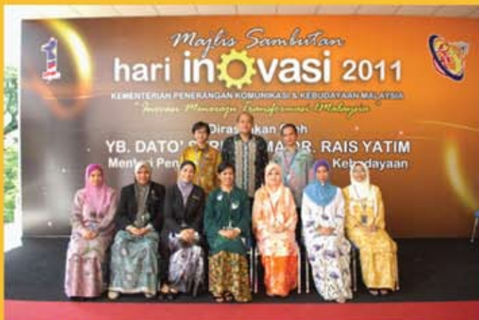
Barisan Urus Setia yang menjayakan Majlis Sambutan Hari Inovasi KPKK 2011.

Tema hari Inovasi tahun ini ialah "Inovasi Meneraju Transformasi Satu Malaysia". Tema Pameran muzium pula adalah "Budaya Inovasi Teras Transformasi", Pameran ini memperlihatkan usaha sebenar JMM khususnya dua pemenang utama suatu program pembudayaan inovasi yang dilaksanakan oleh JMM.