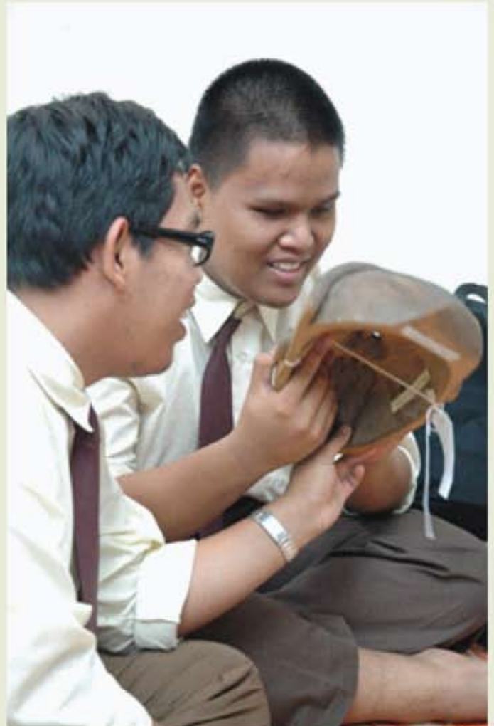
Pelajar dapat menyentuh dan merasai artifak dengan lebih dekat dan teliti.

Selain itu, para pelajar turut didedahkan dengan alat-alat muzik tradisional, di samping dapat bermain alat-alat muzik tersebut serta menyanyi bersama-sama dengan kakitangan Muzium Negara. Lawatan sedemikian sememangnya membolehkan para pelajar khas ini mempunyai pengalaman yang istimewa dalam mengenali serta menghayati pameran di muzium, di samping dapat beramah mesra dengan kakitangan muzium dan sukarelawan muzium. Ternyata bahawa muzium memainkan peranan yang penting sebagai institusi pendidikan tidak formal dan juga meyumbang usahanya dalam membina sebuah masyarakat yang harmoni.