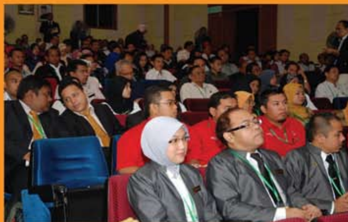
Antara kumpulan yang turut mengambil bahagian dalam pertandingan KIK peringkat KPKK 2011.