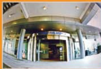
MUZIUM AUTOMOBIL NASIONAL, SEPANG