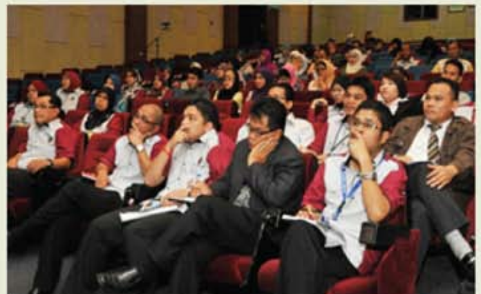
Para peserta seminar sedang mendengar pembentangan daripada pembentang seminar.