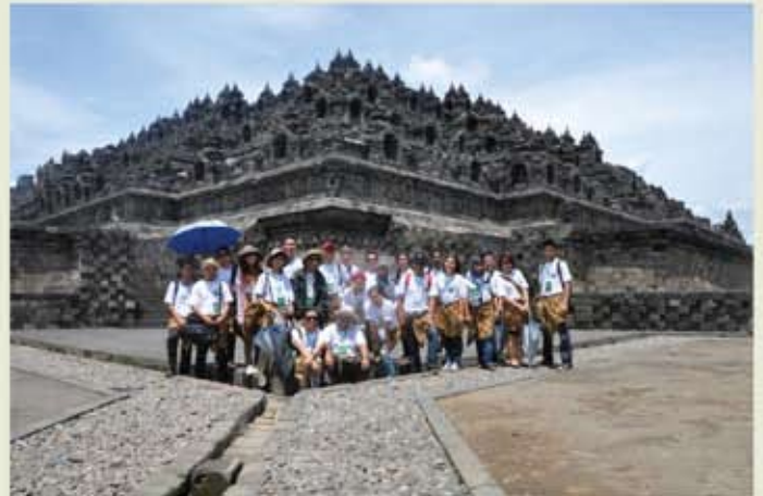
Peserta bergambar kenangan di hadapan candi.

Melalui program ini, para peserta dari seluruh negara ASEAN dapat menguatkan hubungan peribadi dan artistik dalam kalangan belia daripada pelbagai latar belakang disiplin dan cabang seni, mempromosi pengetahuan dan persefahaman melalui interaksi budaya yang berkesan, saling berkongsi dan memupuk persefahaman tentang budaya lokal setiap negara ASEAN yang terlibat dan menggalakkan jalinan perhubungan antara peserta-peserta dari negara ASEAN.