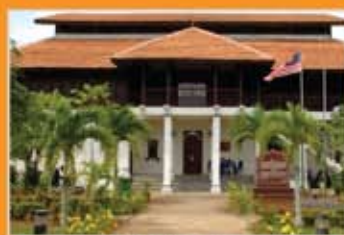
MUZIUM LUKUT, NEGERI SEMBILAN