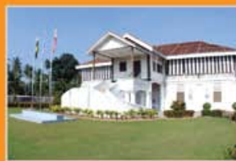
MUZIUM MATANG, PERAK