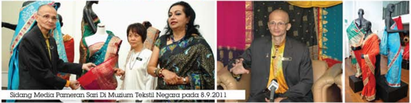
Sidang Media Pameran Sari Di Muzium Tekstil Negara pada 8.9.2011