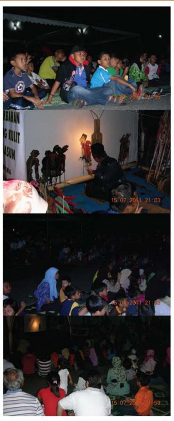
Persembahan wayang kulit oleh Kumpulan Wayang Kulit Seri Asun mendapat sambutan yang luar biasa daripada orang ramai sehingga terpaksa dibentangi di perkarangan letak kereta Muzium Perak.

Antara perkara yang diberikan penekanan ialah teknik melukis watak wayang kulit, teknik memotong dan membentuk corak pada badan watak yang dilukis, proses mewarna watak, proses menyambung bahagian-bahagian badan watak dan menunjukkan cara bagaimana ia dimainkan ketika persembahan wayang kulit diadakan. Pada sebelah malam, Kumpulan Wayang Kulit Seri Asun membuat persembahan wayang kulit di perkarangan Muzium Perak dan ia dibuka kepada orang ramai. Persembahan Wayang Kulit ini mendapat sambutan di luar dugaan sehingga Muzium Perak terpaksa membentangi tikar di atas tempat meletak kenderaan bagi membolehkan orang ramai menyaksikannya. Secara keseluruhannya, program ini berjaya menarik minat orang ramai tanpa mengira usia dan kaum.