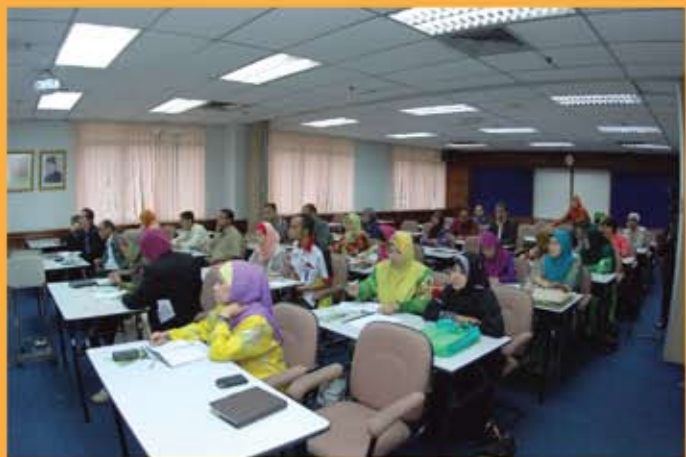
Para peserta yang terlibat bagi Taklimat 5S yang terdiri daripada Kumpulan Pengurusan & Profesional Sokongan 1.

Oleh: Noor Alda binti Hashim, Unit Latihan JMM (nooralda@jmm.gov.my)