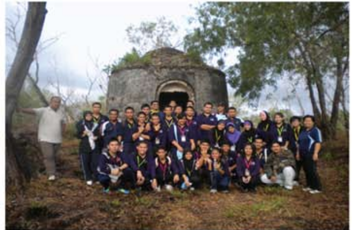
Para peserta bergambar di hadapan Gedung Ubat, salah satu monumen unik di kawasan Tanjung Kubong.

Pada akhir program, lawatan berpandu ke galeri pameran telah diberikan oleh pemudah cara untuk memberikan kefahaman yang jelas mengenai sejarah awal Chimney dan perkaitannya dengan aktiviti perlombongan arang batu di kawasan Tanjung Kubong sekitar abad ke-19. Penganjuran program ini sekali gus dapat meningkatkan jumlah kunjungan pelawat ke Muzium Chimney di samping memupuk kesedaran kepada masyarakat untuk lebih menghayati, menghargai dan peka terhadap kewujudan dan kepentingan monumen serta tapak-tapak bersejarah di kawasan Tanjung Kubong.