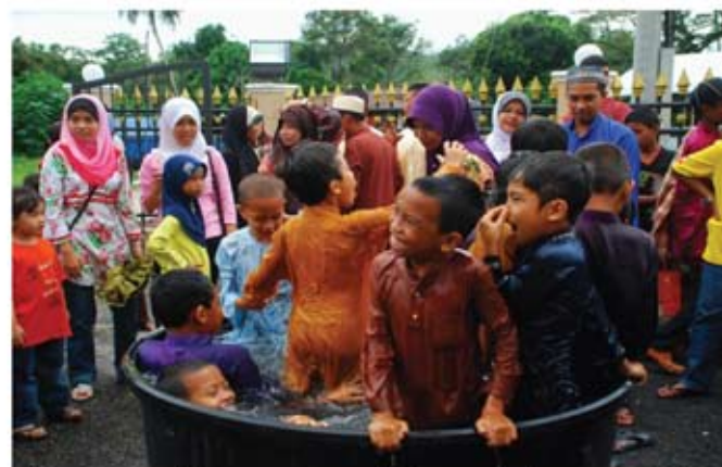
Upacara mandi beramai-ramai diadakan sebelum majlis berkhatan dilakukan.

Dengan penganjuran program seperti ini telah dapat merapatkan hubungan antara masyarakat setempat dengan muzium, di samping mengangkat martabat adat supaya tidak dilupakan dibawa arus pemodenan. Adat didalam kehidupan seharian dapat disesuaikan dengan kehidupan masa kini. Dengan penyesuaian ini diharapkan adat tidak dilupakan.