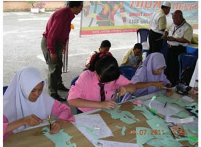
Peserta bengkel sedang melakukan proses membentuk corak pada badan watak wayang kulit.