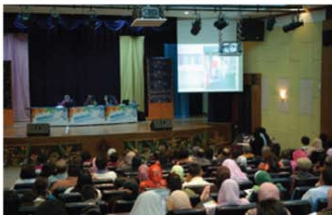
Peserta sedang khusyuk mendengar penerangan serta pembentangan.