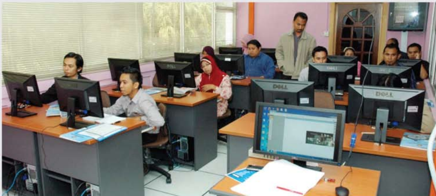
Peserta sedang menyiapkan tugas penyediaan panel grafik sambil dipantau oleh penceramah yang dijemput khas untuk mengendalikan kursus penyediaan panel grafik dan pameran.

Oleh : Syahrizul Amin bin Ahmad, Unit Latihan JMM (shahrizul@jmm.gov.my)