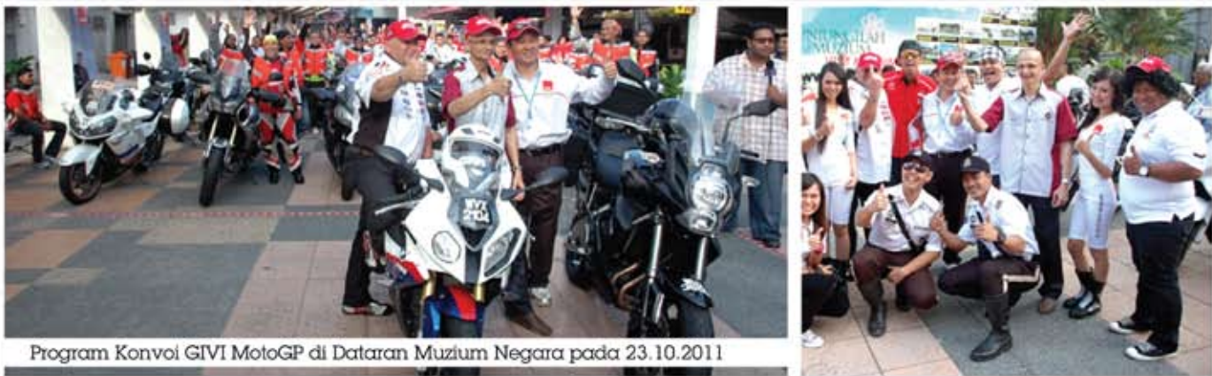
Program Konvoi GIVI MotoGP di Dataran Muzium Negara pada 23.10.2011