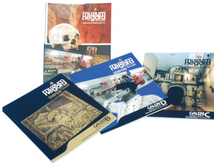
Judul : Panduan Galeri Muzium Negara Penerbit : Jabatan Muzium Malaysia / 2011