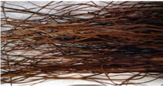
Pokok Ribu-ribu Besar yang telah dikeringkan.

Semenjak sekian lama, serungkup jebak puyuh dibuat dalam saiznya yang tidak begitu besar, lazimnya antara 20 - 30 cm sahaja. Corak pada serungkup menggunakan beberapa teknik anyaman, antaranya dinamai siku keluang dan tulang belut. Namun pada masa kini sudah ditemukan saiz serungkup yang relatifnya cukup besar untuk seekor burung puyuh, namun sebenarnya ia tidak lagi digunakan untuk tujuan tersebut. Sebaliknya fungsi serungkup dalam bentuk dan corak sedemikian telah dipelbagaikan. Dewasa ini pembuat jebak puyuh telah mempelbagaikan penggunaannya menjadi sangkar kucing dan penutup lampu hiasan. Semenjak kebelakangan ini permintaan terhadap jebak puyuh semakin merosot lantaran semakin berkurangnya kegiatan menjebak puyuh dalam kalangan orang ramai, maka pembuat jebak terpaksa mencari alternatif untuk meneruskan kelangsungan hidup. Apatah lagi kini burung puyuh telah ditenak untuk memenuhi permintaan terhadap daging dan telurnya, justeru pengusaha jebak puyuh terpaksa akur kepada persaingan daripada