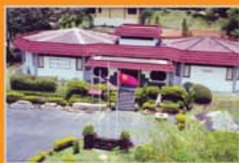
MUZIUM ARKEOLOGI LEMBAH BUJANG, KEDAH