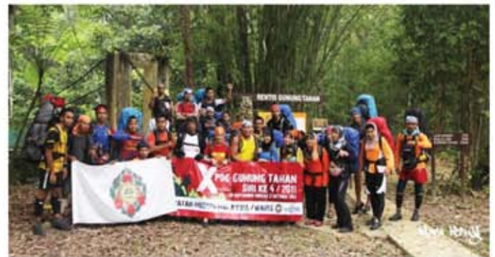
Para pendaki bergambar di pintu masuk utama sebelum memulakan pendakian.

Aktiviti selama empat hari tiga malam itu telah disertai oleh 18 kakitangan Jabatan Muzium Malaysia, empat orang peserta NGO dan dua orang media daripada Majalah Santai. Laluan Merapoh-Gunung Tahan-Merapoh sebagai trek pendakian. Terkenal sebagai puncak gunung tertinggi di Semenanjung Malaysia dengan ketinggian 2,187 meter dari paras laut, sudah semestinya laluan tersedia menjanjikan pelbagai cabaran untuk ditempuh oleh para pendaki.