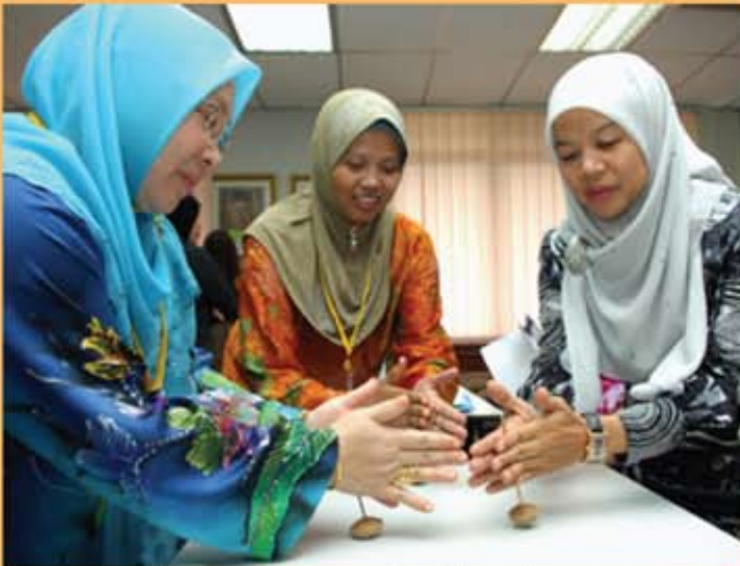
Peserta mencuba permainan gasing buah berembang yang menjadi salah aktiviti hands-on yang disediakan.