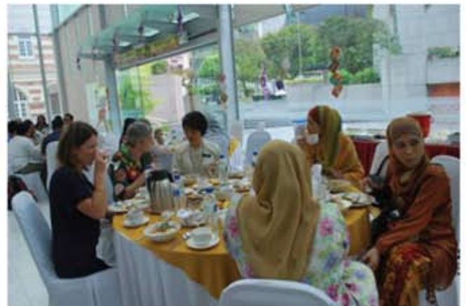
Pengarah Muzium Tekstil Negara beramah mesra dengan tetamu sambil memperkenalkan hidangan istimewa sempena rumah terbuka.