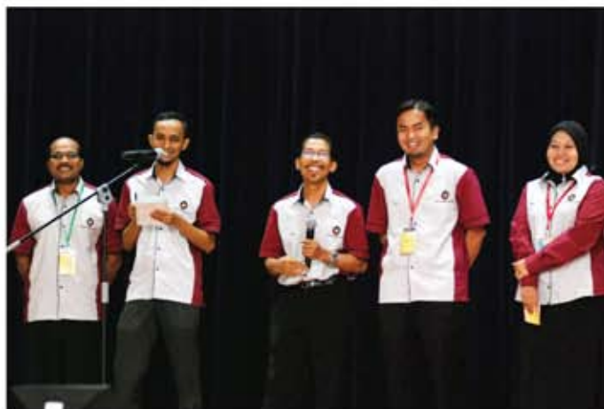
Kumpulan Jemari Kreatif dari JMM sedang menjawab soalan dari panel hakim dalam sesi soal jawab setelah selesai membentangkan projek KIK mereka.

Beliau berkata demikian ketika berucap merasmikan Konvensyen KIK pada 22 November 2011 di Auditorium JMM. Jelasnya, nilai-nilai murni yang dipupuk dalam KIK seperti semangat berpasukan, ketekunan, kegigihan dan lampas otak harus dikekalkan dalam kerja-kerja seharian supaya KPKK dikenali sebagai kementerian yang tinggi prestasinya. Beliau turut menyeru kepada kakitangan KPKK untuk terus menghayati usaha pembudayaan inovasi dan kreativiti. Tambahnya, inovasi bukan sahaja menjadi kunci kejayaan kepada sesebuah organisasi, malah ia juga berperanan melonjakkan kemajuan sesebuah negara sehingga berjaya mengukuhkan kedudukan di dalam ranking daya saing global.