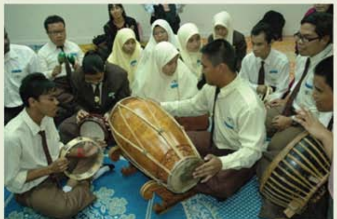
Para pelajar seronok bermain alat muzik dan menyanyi lagu raya Aidilfitri.