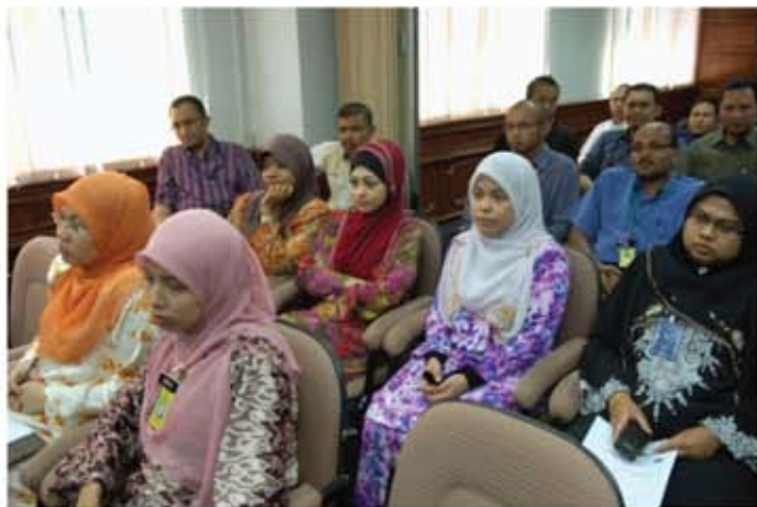
Para peserta sedang mendengar ceramah.

Seramai 61 orang peserta daripada kakitangan Kumpulan Pengurusan dan Profesional, Sokongan 1 dan Sokongan 2 daripada Jabatan Muzium Malaysia telah terlibat dalam menjayakan ceramah Bina Hati Cemerlang. Sehubungan itu, Jabatan amat berharap pada masa akan datang, ceramah Pengisian Rohani ini dapat diadakan lagi dari masa ke semasa supaya dapat menerapkan nilai-nilai murni didalam kalangan kakitangan JMM.