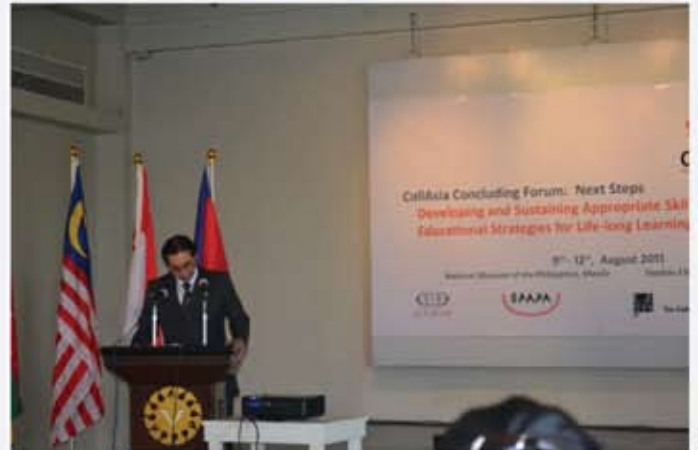
Majlis perasmian CollAsia Concluding Forum oleh Mr Jeremy Barns, Pengarah National Museum of Philippine spada 09 Ogos 2011 di National Museum of Philippines.

Kesimpulan yang dapat dibuat ialah forum seumpama ini amat baik sebagai pendedahan kepada semua pegawai yang mempunyai pengalaman dalam bidang permuziuman serta dapat berkongsi dengan rakan-rakan sepejuangan dari negara luar yang menjalankan rutin dan bidang kerja yang sama.