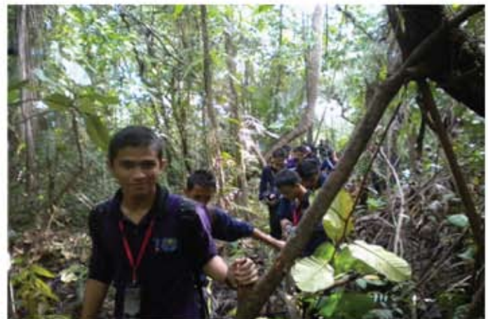
Para peserta menuju laluan masuk ke Tapak Perkuburan British, salah satu monumen yang terdapat di Tanjung Kubong.