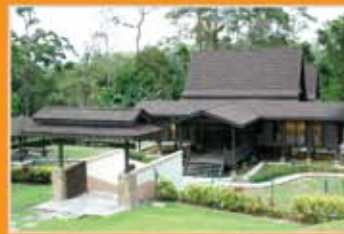
MUZIUM KOTA JOHOR LAMA, JOHOR