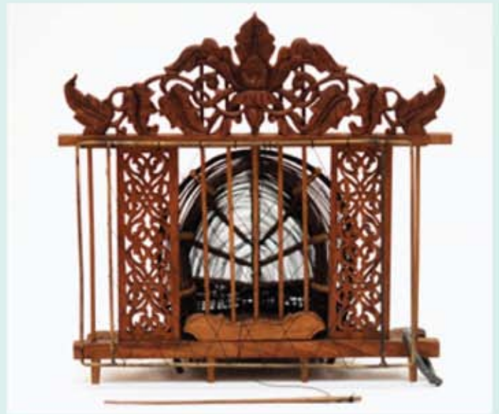
Bahagian gunung dukir penuh dengan motif ketumbit daripada punca benih atau punca rahata. Dua sisi penutupnya dukir berkerawang motif sulur bayu.

Kini, jebak puyuh lazim dapat dilihat di muzium-muzium, galeri-galeri seni dan orang perseorangan yang meminati khazanah warisan silam. Malahan, bukan sedikit orang muda zaman sekarang yang tidak mengenali langsung Jebak Puyuh ini. Walaupun pengusaha masa kini masih menggunakan sumber tumbuhan sebagai motif ukiran, namun maksud tersirat di sebalik penghasilan motif tersebut tidak lagi memenuhi aspirasi dan falsafah