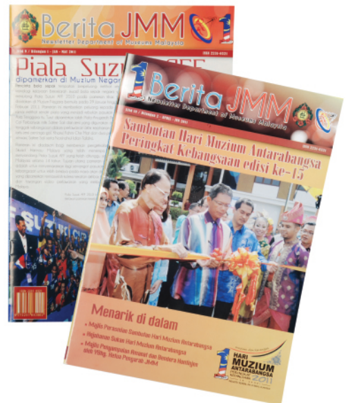
Judul : Berita JMM Jilid 9 Bil.1 / Jilid 10 Bil.2 Penerbit : Jabatan Muzium Malaysia / 2011