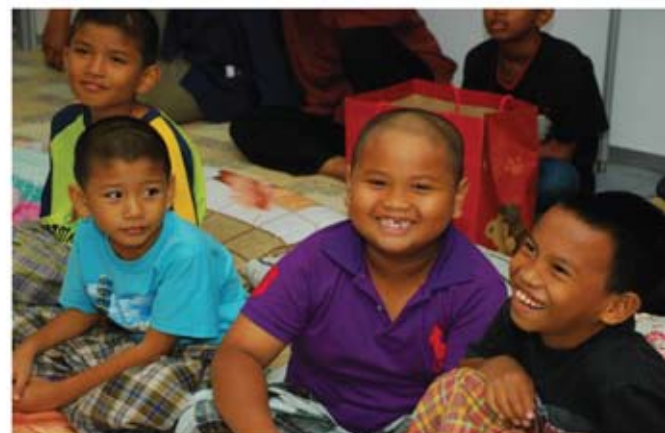
Antara kanak-kanak yang menunggu giliran untuk dikhatamkan.