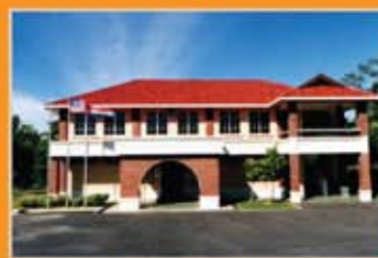
MUZIUM CHIMNEY, LABUAN