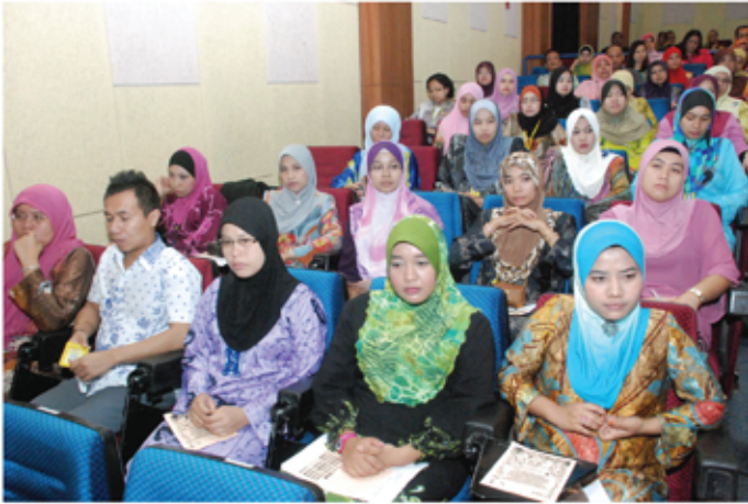
Staf JMM yang hadir sedang mendengar taklimat yang disampaikan oleh YBhg. Dato' KSU.

Ini adalah seiring dalam melaksanakan amanat Ketua Setiausaha Negara dan YBhg. Tan Sri KPPA bagi melahirkan sebuah organisasi yang dapat digerakkan dengan jumlah kakitangan yang minimum dengan bantuan kemajuan teknologi yang tinggi. Walaupun bilangan kakitangan akan dikurangkan tetapi kecekapan dan produktiviti akan bertambah dengan adanya kakitangan yang pelbagai guna dan pelbagai kemahiran.