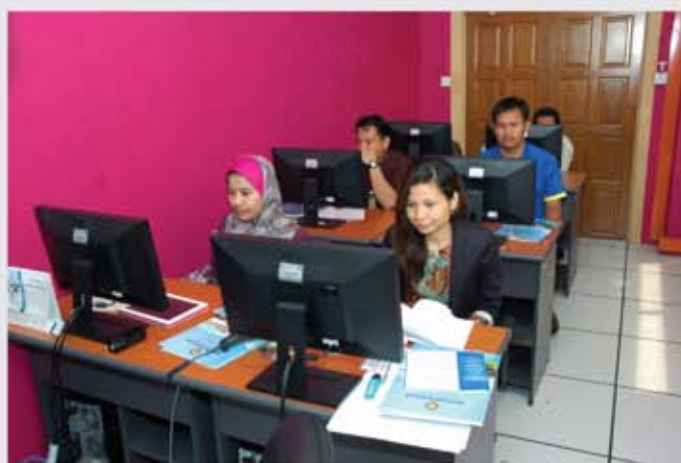
Para peserta sedang mendengar taklimat dari penceramah.

Seramai 16 orang peserta Kumpulan Sokongan 1 (Gred 32 - 17 ) daripada Jabatan Muzium Malaysia dan 4 orang peserta luar mengikuti Kursus Penyediaan Panel Grafik dan Pameran pada kali ini.