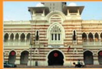
MUZIUM TEKSTIL NEGARA, KUALA LUMPUR