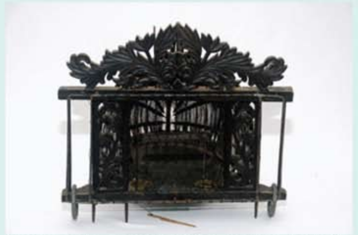
Gunungan dihiasi ukiran tebuk tembus bermotif daun menyerupai daun lantar/ta.

menganyam dan mengukir. Keunikan bentuk dan seni hias ukiran pada bahagian kepala dan badan jebak menjadikan ia sangat istimewa dan indah. Apatah lagi jebak puyuh yang dimiliki oleh golongan bangsawan, segalanya diukir dengan begitu halus dan berseni, khususnya pada bahagian gunung yang secara tidak langsung dapat menjadi lambang status pemiliknya. Pada zaman itu, gunung adalah ukiran khas yang digunakan untuk memberikN makna status dan keunikan kepada golongan yang mempunyai kuasa, selain dikatakan sebagai mempunyai pengaruh etos Hindu.