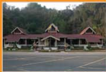
MUZIUM KOTA KAYANG, PERLIS