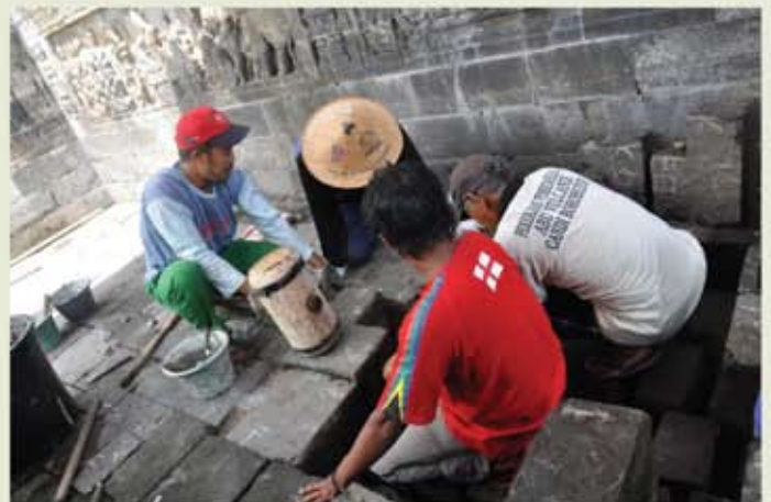
Aktiviti membaik pulih struktur candi merupakan salah satu aktiviti yang mencabar peserta.