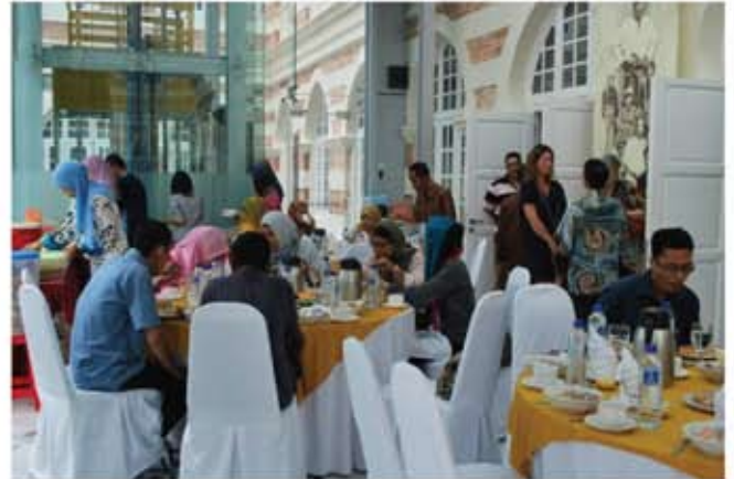
Tetamu sedang menikmati juadah hari raya yang disediakan.