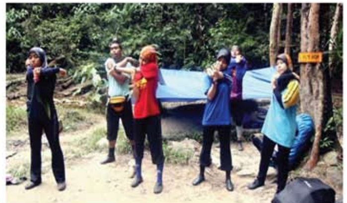
Regangan otot dilakukan sebelum pendaki memulakan pendakian.