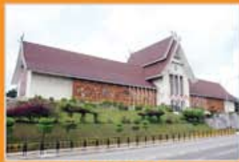
MUZIUM NEGARA, KUALA LUMPUR