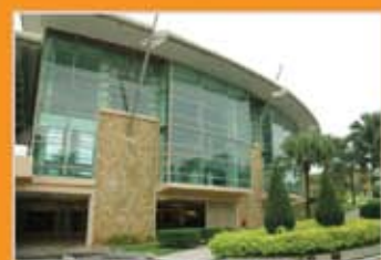
MUZIUM ALAM SEMULA JADI, PUTRAJAYA