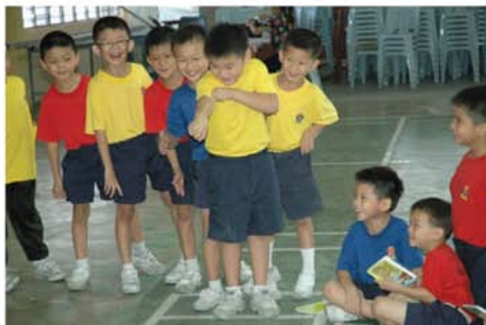
Aktiviti permainan baling getah di SJK(C) Kampung Gurney, Ulu Yam Baru.