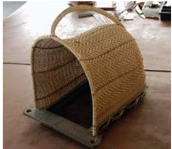
Sangkar kucing - saiz serungkup sehingga 50 cm.