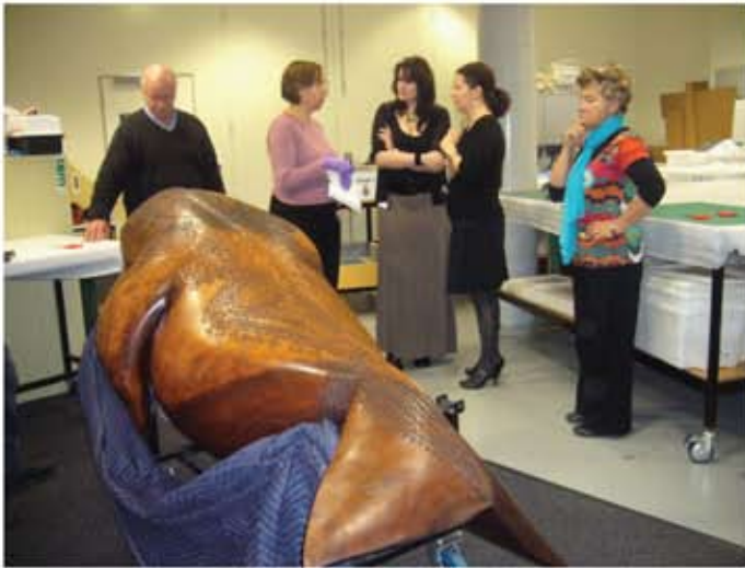
Konservator dan kurator berbincang mengenai keperluan membaik pulih artifak sebelum diputuskan untuk dipamerkan.

Oleh: Norzila Diana Mansor, Coordination and Monitoring Division (diana@jmm.gov.my)