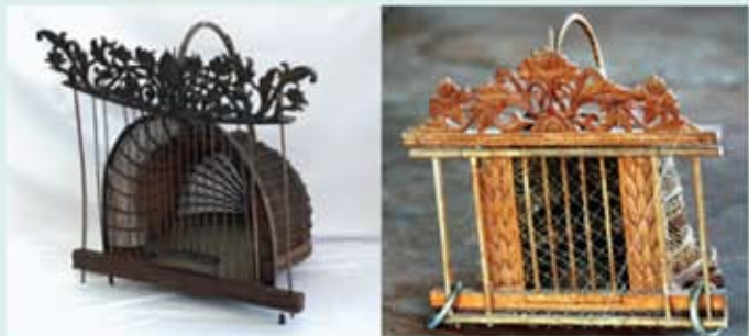
Perbezaan motif lama dan motif baharu. Sebelah kiri menggunakan motif lama, lazimnya bersumberkan bunga kecil dengan sulur menaik ke atas. Di sebelah kanan menggunakan motif baharu, dengan bunga ros sebagai inspirasi.

Kini, jebak puyuh lazim dapat dilihat di muzium-muzium, galeri-galeri seni dan orang perseorangan yang meminati khazanah warisan silam. Malahan, bukan sedikit orang muda zaman sekarang yang tidak mengenali langsung Jebak Puyuh ini. Walaupun pengusaha masa kini masih menggunakan sumber tumbuhan sebagai motif ukiran, namun maksud tersirat di sebalik penghasilan motif tersebut tidak lagi memenuhi aspirasi dan falsafah