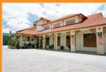
MUZIUM ARKEOLOGI LENGGONG, PERAK