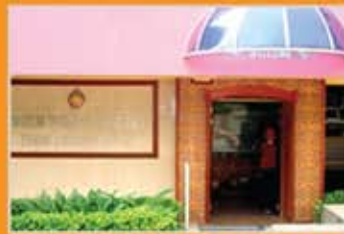
MUZIUM SENI KRAF ORANG ASLI, KUALA LUMPUR