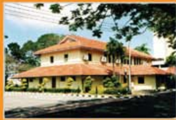
MUZIUM LABUAN, LABUAN