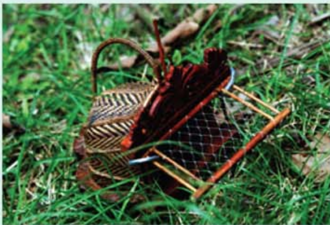
Jebak diletakkan di atas tanah pada kawasan bersemak untuk menjerat burung puyuh

Semasa memburu puyuh liar, jebak ini akan diletakkan di celah-celah tumbuhan, biasanya di kawasan semak atau belukar kecil yang agak tersembunyi dan diletakkan pada kedudukan rata di permukaan tanah. Seekor puyuh denak akan diletakkan di dalam jebak, bertindak sebagai pemikat melalui bunyi ciapan yang dihasilkan. Tali jerat akan dilaraskan pada pintu jebak dengan cara menongkatkan tiang pelantik pada muka pintunya. Sebaik burung liar masuk dan terpijak atau terlanggar tali jerat yang dipasang, dengan sendirinya pintu jebak yang berjaring akan jatuh dan seterusnya memerangkap puyuh di dalamnya.