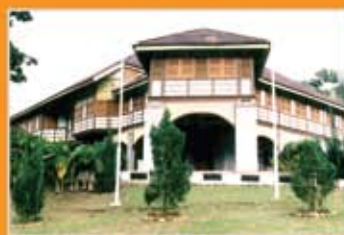
MUZIUM SUNGAI LEMBING, PAHANG