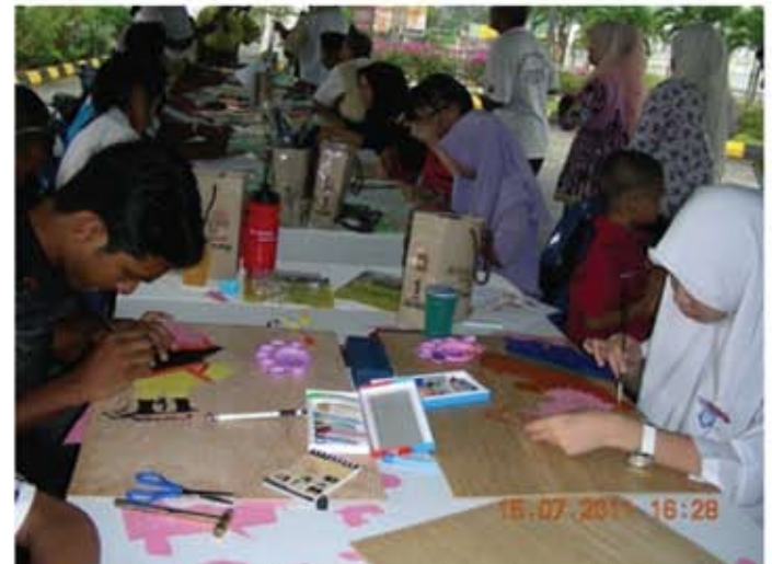
Proses mewarna watak wayang kulit sedang dilakukan bagi memberikan penekanan kepada watak supaya watak yang ditunjukkan lebih berkesan.