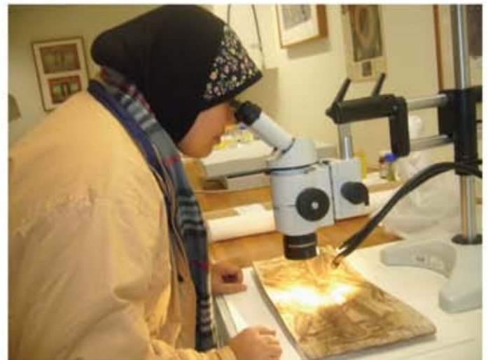
Pendedahan untuk mengenal pasti tahap kerosakan koleksi yang diperbuat daripada kulit kayu.

Faedah-faedah yang diperoleh daripada program ini ialah peserta mendapat maklumat berkaitan cara-cara melaksanakan sistem pendaftaran artifak yang lebih sistematik dan mewujudkan makmal konservasi yang lengkap. Di samping itu, Jabatan ini turut berharap untuk membina rangkaian kerjasama dengan NMA untuk berkongsi maklumat dan kepakaran.