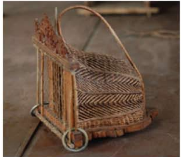
Jebak Puyuh - serungkup bersaiz kecil hingga sederhana.

pengusaha ternak puyuh. Jebak puyuh hanya dihasilkan berdasarkan permintaan khusus daripada peminatnya atau ditempah oleh institusi tertentu atas tujuan yang tertentu juga.