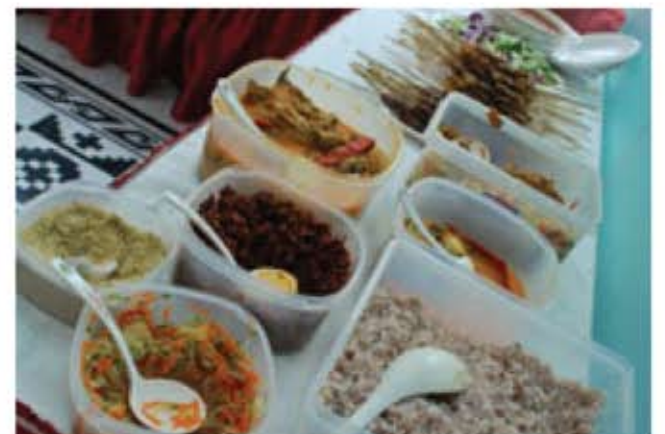
Antara juadah istimewa yang disediakan untuk santapan para tetamu yang hadir.