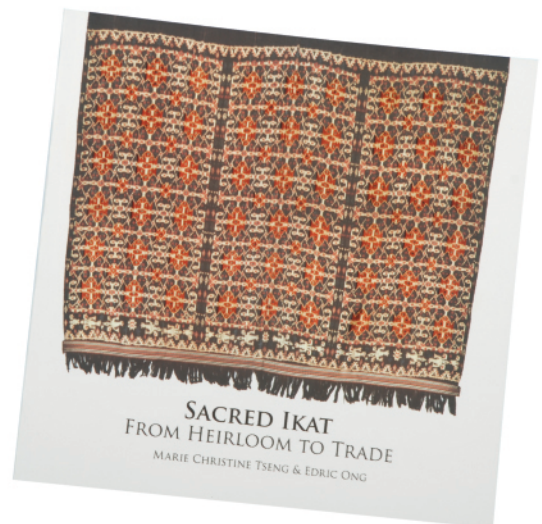
Judul : Sacred Ikat From Heirloom To Trade Penerbit : Jabatan Muzium Malaysia / 2011