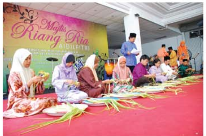
Pertandingan menganyam ketupat yang diadakan telah memeriahkan lagi Majlis Riang Ria Aidilfitri.