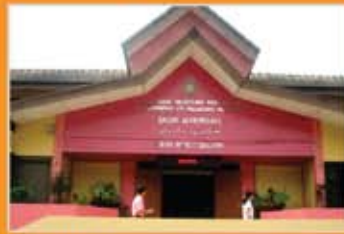
MUZIUM ETNOLOGI DUNIA MELAYU, KUALA LUMPUR