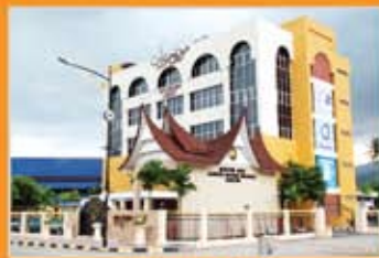
MUZIUM ADAT, JELEBU, NEGERI SEMBILAN