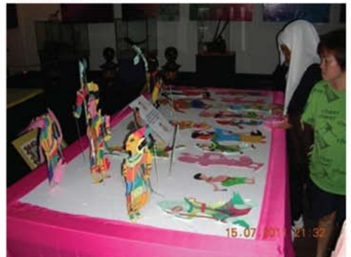
Hasil kerja tangan peserta bengkel ini dipamerkan kepada pengunjung di Muzium Perak selama seminggu.