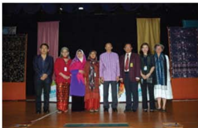
YBhg. Dato' Ibrahim bin Ismail, Ketua Pengarah Jabatan Muzium Malaysia bergambar bersama pembentang-pembentang serta moderator.

Peserta seminar terdiri daripada warga Jabatan Muzium Malaysia dan peserta luar. Sambutan yang diterima amat menggalakkan.