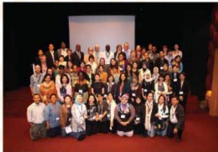
▲ Sesi bergambar semua peserta Persidangan CAM Triennial Conference 2011 di Singapura.