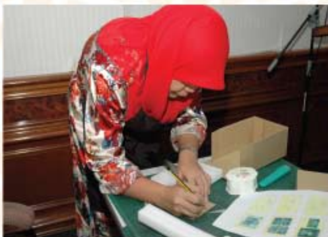
▲ Salah seorang peserta sedang tekun mengaplikasikan teknik yang telah dipelajari daripada bengkel yang disertainya.