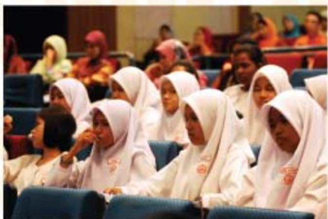
▲ Pelajar sekolah turut dijemput untuk sama-sama berkongsi ilmu dalam program yang diadakan.