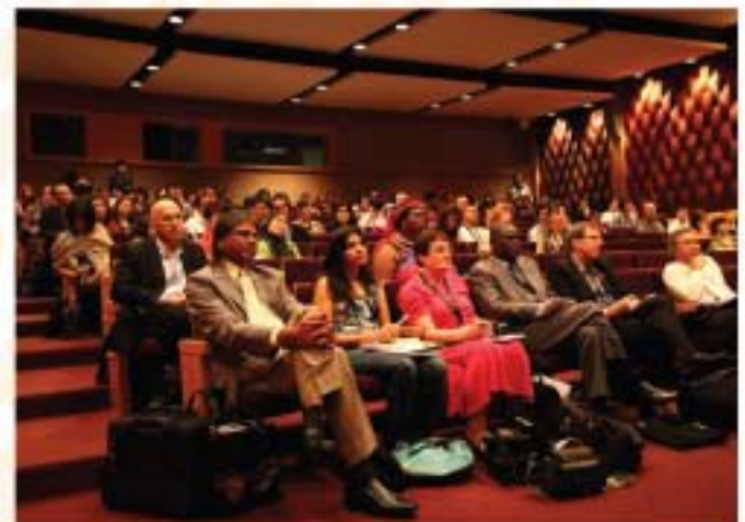
▲ The participants concentrated on the paperwork presentation.

CAM's annual general meeting was conducted at the end of the conference together with the resolution that signalled the unity among the members in relation to the matters raised. At the same time, it has opened the minds of the participants to view the scope and role of museums in a broader perspective, particularly in addressing or highlighting the socio-economic issues, education, youth participation and global issues. JMM should consistently participate in this meaningful program and carry the active role especially in paperwork presentation which focused on the experience and nation's achievements in museum field and heritages including lobbying as CAM's committee member.