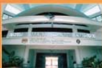
MUZIUUM MARIN LABUAN, LABUAN