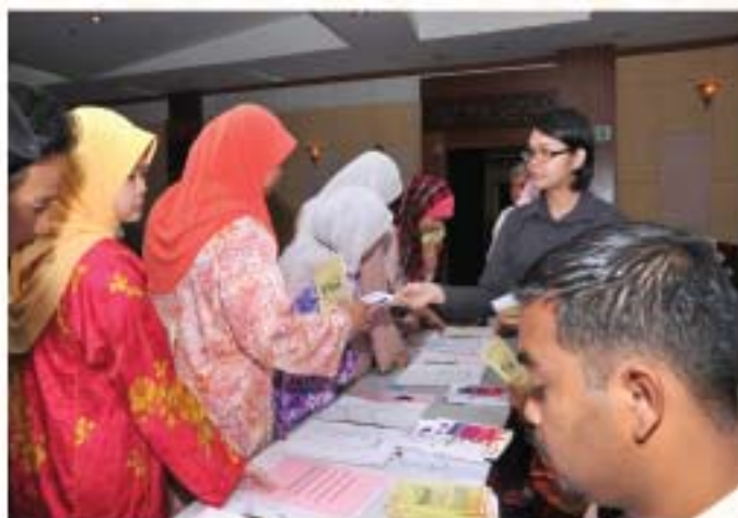
▲ Staf yang hadir mendaftar di meja pendaftaran.

Perhimpunan JMM telah diadakan pada 10 Mei 2011 di Auditorium JMM dengan kehadiran seramai 190 orang pegawai dan kakitangan. Perhimpunan JMM dimulakan dengan nyanyian lagu Negaraku dan Perkhidmatan Awam diringi oleh Kumpulan Koir JMM, kemudian diikuti bacaan Ikrar Perkhidmatan Awam dan bacaan doa. Seterusnya, YBhg. Dato' Ibrahim bin Ismail telah menyampaikan ucapan dan amanat beliau. Antara intipati ucapan YBhg. Dato' Ibrahim bin Ismail, ialah berkaitan dengan sambutan Hari Muzium Antarabangsa peringkat kebangsaan dari 18 hingga 24 Mei 2011 di Seremban, Negeri Sembilan. Di samping menggariskan program-program yang akan dilangsungkan, Ketua Pengarah menyatakan penghargaan kepada pegawai dan staf yang terlibat dalam merancang dan menguruskan perjalanan aktiviti untuk kejayaan program tersebut. Selain itu, beliau juga memberikan penekanan terhadap budaya menambahkan ilmu. Seiring dengan kejayaan Unit Perpustakaan membuat perolehan buku-buku baharu terbitan dalam dan luar negara, YBhg. Dato' Ibrahim berharap perolehan tersebut haruslah dimanfaatkan sepenuhnya oleh warga JMM dengan menjadikan membaca sebagai budaya setiap masa.