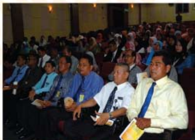
▲ Warga JMM yang hadir dalam Majlis Jasamu Dikenang, Penghargaan Perkhidmatan 25 tahun dan Anugerah Perkhidmatan Cemerlang 2010.