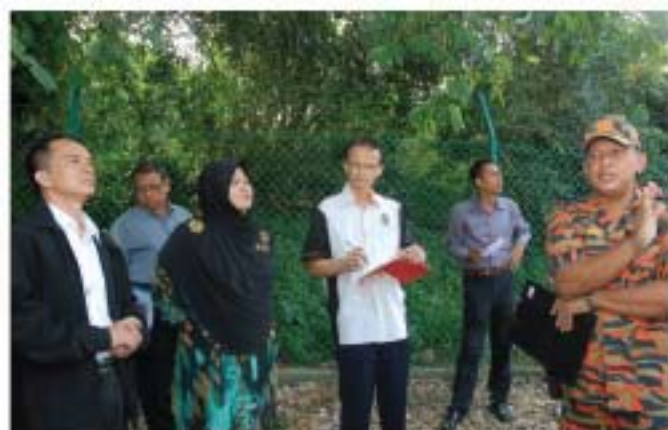
▲ Ketua Pengarah JMM dan Ketua Pegawai Eksekutif PADAT mendengar taklimat yang disampaikan oleh Penolong Penguasa Bomba, Balai Bomba dan Penyelamat Kuala Selangor.

Pada 17 Jun 2011, YBhg. Dato' Ibrahim bin Ismail, Ketua Pengarah Jabatan Muzium Malaysia telah mengadakan lawatan ke tapak kebakaran bangunan Muzium Permainan Tradisional Rakyat, Bukit Malawati di Kuala Selangor. Lawatan berkenaan yang menggambarkan sokongan moral dan simbol keprihatinan beliau kepada muzium-muzium negeri turut disertai beberapa orang pegawai Jabatan Muzium Malaysia. Muzium Permainan Tradisional telah terbakar pada 15 Jun 2011 yang dipercayai berpunca akibat litar pintas pada papan suis utama. Kebakaran tersebut telah mengakibatkan kerosakan sebahagian besar bumbung dan galeri pameran, namun kepantasan kakitangan muzium berjaya menyelamatkan koleksi pameran.