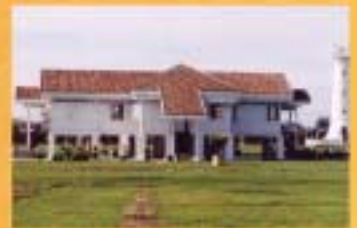
MUZIUUM KOTA KUALA KEDAH, KEDAH