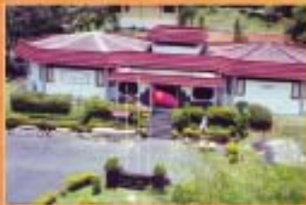
MUZIUUM ARKEOLOGI LEMBAH BUJANG, KEDAH