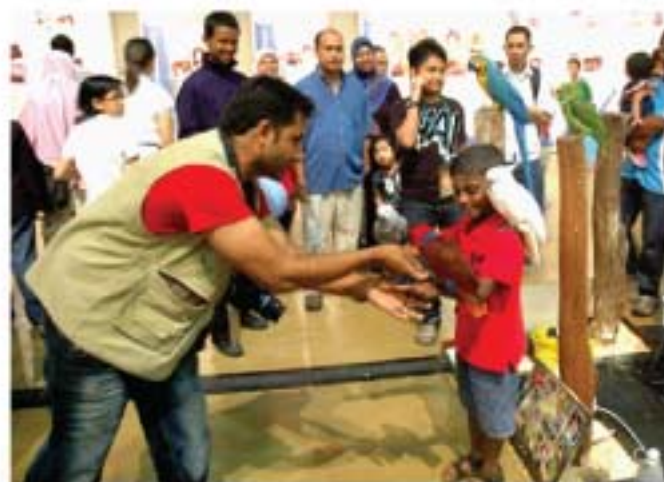
▲ Sesi bergambar dengan burung di gerai pameran JMM amat menarik perhatian orang ramai.

Sepanjang tempoh pameran berlangsung, lebih lima ribu pengunjung telah melawat ke gerai-gerai pameran JMM. Pelbagai peringkat usia sama ada kanak-kanak, remaja dan orang dewasa telah berpusu-pusu mengunjungi gerai pameran untuk menyertai pelbagai aktiviti yang disajikan. Berdasarkan sambutan begitu hangat yang diterima adalah diharap agar JMM dapat menyertai aktiviti tahunan ini pada masa akan datang.