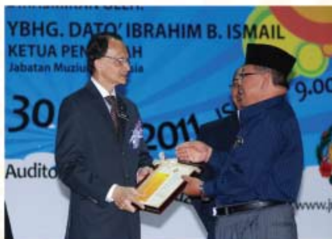
▲ YBhg. Dato' KP menyampaikan sijil penghargaan kepada salah seorang kakitangan yang telah berkhidmat selama 25 tahun.