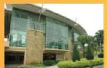
MUZIUUM ALAM SEMULA JADI, PUTRAJAYA