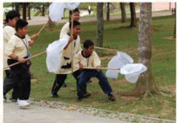
▲ Peserta sedang mengaplikasikan cara-cara mengumpul koleksi rama-rama.