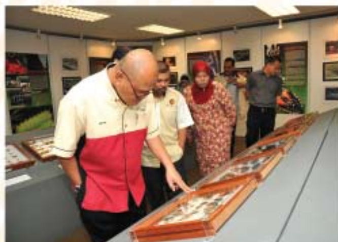
▲ Staf JMM tertarik dengan koleksi yang dipamerkan ketika lawatan mereka ke Muzium Alam Semula Jadl.