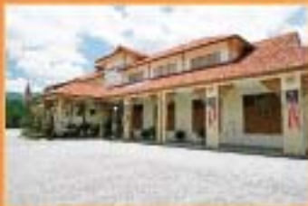
MUZIUUM ARKEOLOGI LENGGONG, PERAK