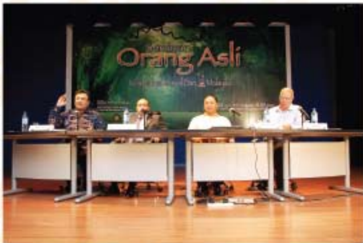
▲ Barisan panel pembentang Seminar Orang Asli yang diadakan sempena Karnival Orang Asli bertempat di Auditorium JMM pada 28 Jun 2011.