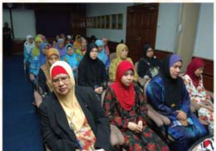
▲ Antara staf JMM yang hadir mengimarahkan majlis.