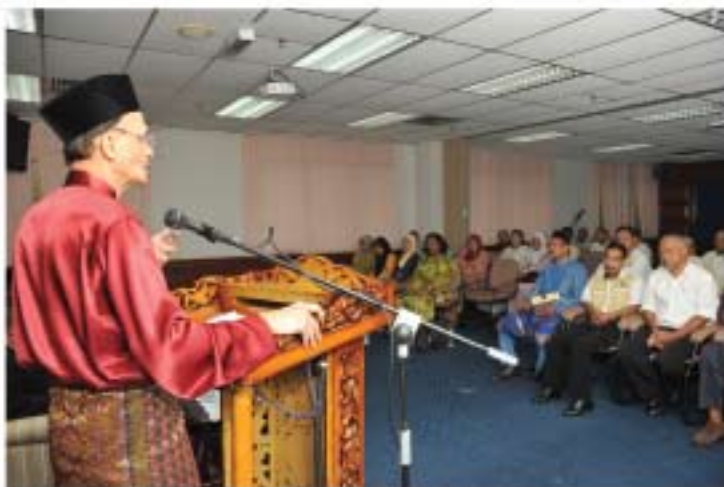
▲ YBhg. Dato' Ibrahim bin Ismail, Ketua Pengarah JMM menyampaikan amanat beliau ketika Majlis Perjumpaan Pengurusan Tertinggi dengan Staf Kumpulan Sokongan 2 pada 5 April 2011 di Bilik Persidangan JMM.