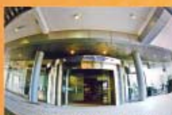
MUZIUUM AUTOMOBIL NASIONAL, SEPAANG