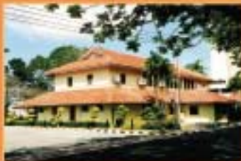
MUZIUUM LABUAN, LABUAN