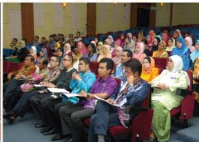
▲ Pegawai-pegawai dan staf JMM yang hadir ke majlis taklimat.