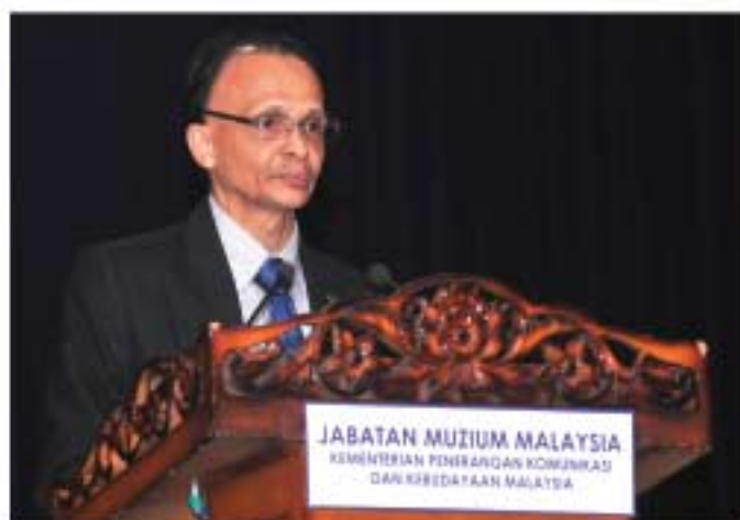
▲ YBhg. Dato' Ibrahim bin Ismail, Ketua Pengarah JMM menyampaikan amanat dalam Perhimpunan JMM.

Ketua Pengarah JMM juga berjanji akan memberikan peluang kepada warga JMM melalui program-program yang dirancang agar mereka dapat melawat muzium-muzium di bawah pentadbiran JMM dan secara tidak langsung meningkatkan kefahaman tentang peranan, sejarah dan aktiviti muzium-muzium yang sedia ada.