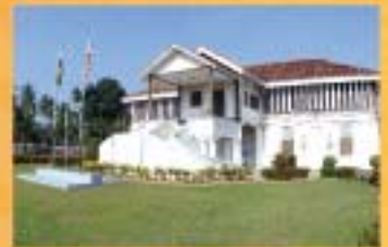
MUZIUUM MATANG, PERAK