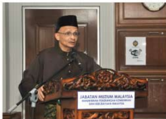
▲ YBhg. Dato' Ibrahim bin Ismail, Ketua Pengarah JMM menyampaikan amanat bellau.

Sesi Perjumpaan Pengurusan Tertinggi dengan seramai 65 orang staf Kumpulan B (Gred 27-40) pula diadakan pada 25 April 2011 bertempat di Auditorium JMM.