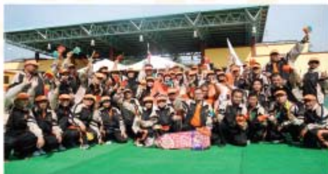
▲ Peserta perbarisan dari Zon Wilayah bergambar selepas berjaya menjadi juara perbarisan sempena Hari Muzium Antarabangsa 2011.

Semangat kesukanan, daya saing dan silaturahim yang terjalin sepanjang kejohanan sukan ini telah membuktikan bahawa muzium-muzium di Malaysia juga mempunyai bakat-bakat sukan yang hebat dan mampu untuk lebih menonjol lagi pada masa akan datang. Apa yang lebih penting ialah semangat kerjasama yang padu oleh seluruh warga muzium telah melancarkan keseluruhan kejohanan malah dapat direalisasikan dalam suasana penuh harmoni.