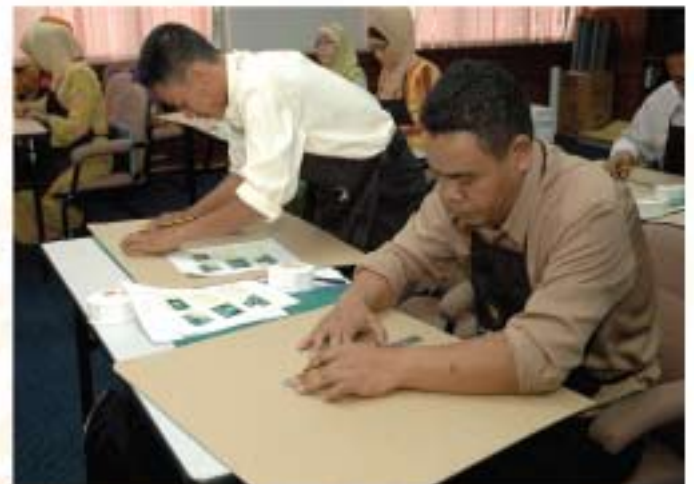
▲ Peserta memotong bahan asas dalam menghasilan sokongan artifak.