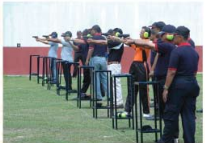
▲ YBhg. Dato' Ibrahim bin Ismail, Ketua Pengarah JMM turut serta dalam acara menembak ketika Hari Muzium Antarabangsa 2010 di Negeri Sembilan pada 19 Mei 2011.