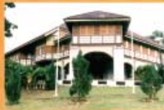
MUZIUUM SUNGAI LEMBING, PAHANG