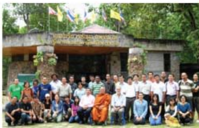
▲ Peserta bergambar kenangan di Taman Sejarah di Phu Phrabat, Udon Thani, Thailand.

Bengkel ini terbahagi kepada dua bahagian, iaitu bahagian pertama sesi ceramah tentang teori dan pengetahuan asas lukisan batu. Setiap peserta dikehendaki menyediakan laporan dan membentangkan hasil penyelidikan lukisan batu yang terdapat di negara masing-masing. Manakala bahagian kedua pula ialah lawatan ke lapangan, iaitu di Taman Negara, Pha Team di daerah Ubon Ratchathani dan Taman Sejarah, Phu Phrabat di daerah Udon Thani bahagian Utara Thailand. Bahagian ini memberikan tumpuan secara langsung penglibatan peserta untuk membuat analisis arkeologi dan interpretasi terhadap lukisan batu yang terdapat di kedua-dua tempat tersebut. Perbincangan secara berkumpulan juga telah dilakukan mengikut tajuk yang telah diberikan oleh pihak urus setia. Peserta turut diberikan bimbingan dan berkongsi pengetahuan mereka mengenai pengurusan dan pemuliharaan tapak-tapak sejarah.