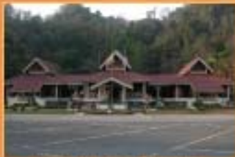
MUZIUUM KOTA KAYANG, PERLIS