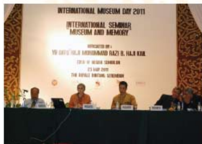
▲ Barisan pembentang seminar yang bertajuk "Muzium dan Memori".