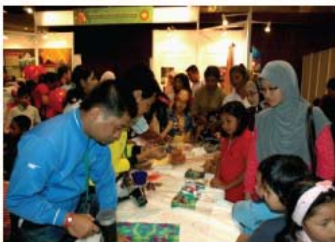
▲ Pengunjung amat tertarik dengan teknik ikat dan celup yang menghasilkan motif berwarna-warni di atas kertas tisu.