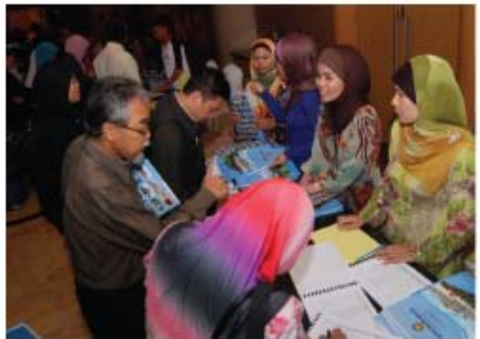
▲ Peserta seminar sedang mendaftar di meja pendaftaran sebelum memasuki dewan seminar yang diadakan sempena Hari Muzium Antarabangsa.

Sesungguhnya Sambutan Hari Muzium Antarabangsa Peringkat Kebangsaan 2011 telah meninggalkan kenangan yang cukup mendalam kepada warga muzium yang terlibat. Dedikasi serta komitmen yang ditunjukkan membuktikan bahawa kesepaduan serta kerjasama yang padu dalam kalangan warga Muzium Malaysia telah memastikan penganjuran pada kali ini mencapai matlamat dan objektifnya. Semoga berjumpa lagi pada tahun 2012 di Negeri Pahang Darul Makmur.