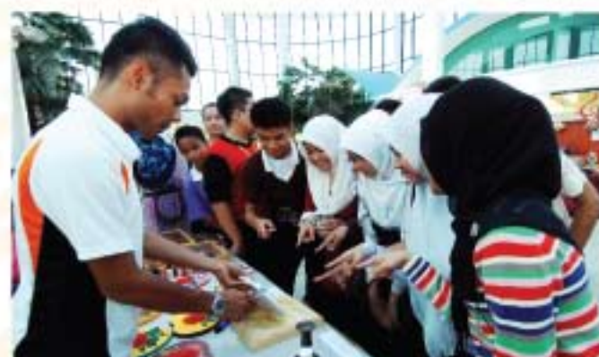
▲ Aktiviti demonstrasi konservasi artifak diminati oleh pelajar sekolah.

Pada akhir program telah diadakan Majlis Perjumpaan Media bersama Ketua Pengarah JMM dan penyampaian cenderahati kepada para wartawan pada 4 April 2011. Ketua Pengarah JMM telah menyuarakan harapan agar wartawan dan pengamal media memainkan peranan penting dalam mempromosi muzium-muzium di negara ini.