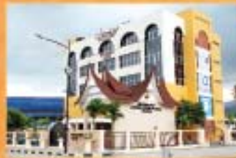
MUZIUUM ADAT, JELEBU, NEGERI SEMBILAN