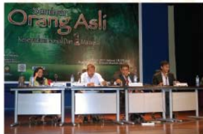
▲ Barisan panel yang diundang membentangkan kertas kerja sempena Seminar Orang Asli.