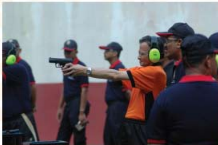
▲ YBhg. Dato' Ibrahim bin Ismail, Ketua Pengarah JMM turut serta dalam acara menembak ketika Hari Muzium Antarabangsa 2010 di Negeri Sembilan pada 19 Mei 2011.