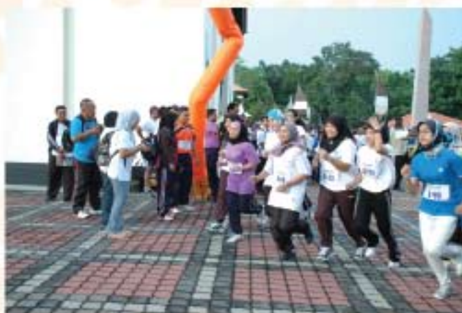
▲ Peserta muziumthon yang mengambil bahagian dilepaskan mengikut kategori masing-masing.