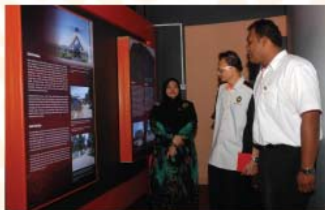
▲ Ketua Pengarah JMM melawat Muzium Sejarah Daerah Kuala Selangor dengan diiringi oleh Ketua Pegawai Eksekutif PADAT.

Sebagai reaksi segera dan tindakan pencegahan susulan daripada lawatan berkenaan, Ketua Pengarah JMM telah mengarahkan Unit Keselamatan JMM untuk membuat pemantauan segera terhadap aspek keselamatan semua muzium di bawah JMM bagi mengelakkan sebarang kejadian tidak diingini.