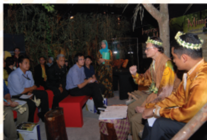
▲ Sesi sidang media oleh Ketua Pengarah JMM di dalam galeri pameran.

Satu sidang media mengenai festival ini telah diadakan oleh Ketua Pengarah JMM pada 21 April 2011 di ruang galeri pameran yang dihadiri oleh pihak media dan wartawan daripada pelbagai agensi.