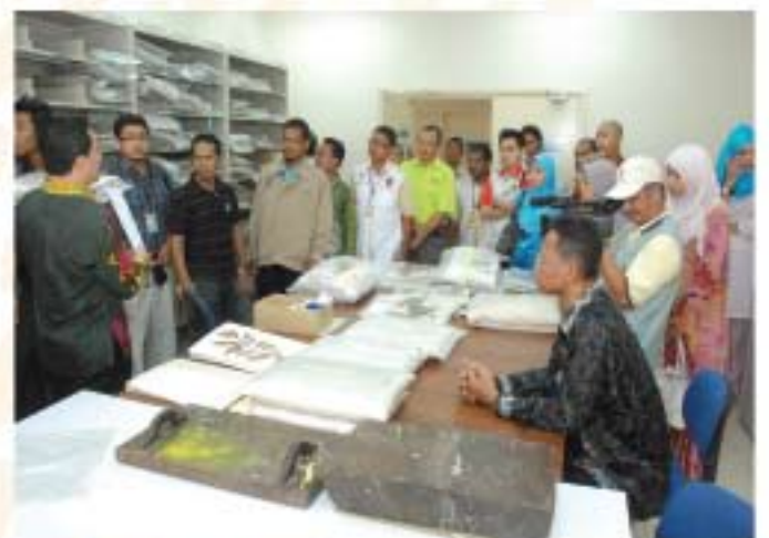
▲ Semua peserta sedang mendengar penerangan daripada tenaga pengajar.