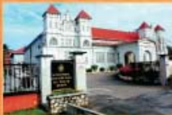
MUZIUUM PERAK, TAIPING, PERAK