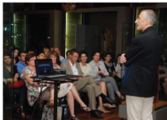
▲ Sukarelawan Muzium sedang memberi taklimat kepada pelawat-pelawat Muzium Negara.

Keanggotaan baharu yang bakal menamatkan latihan pada 5 Mac 2011 ialah seramai 45 orang, iaitu 10 orang warganegara Jepun, 10 orang warganegara Malaysia (3 Melayu, 4 Cina, 3 India)