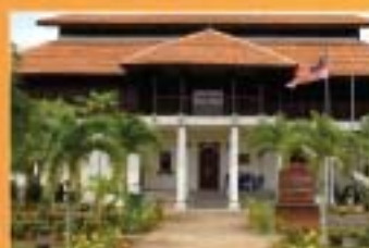
MUZIUUM LUKUT, NEGERI SEMBILAN