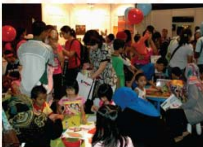
▲ Kelihatan gerai pameran JMM yang penuh sesak dengan kunjungan orang ramai untuk menyertai pelbagai aktiviti interaktif.