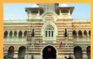
MUZIUUM TEKSTIL NEGARA, KUALA LUMPUR