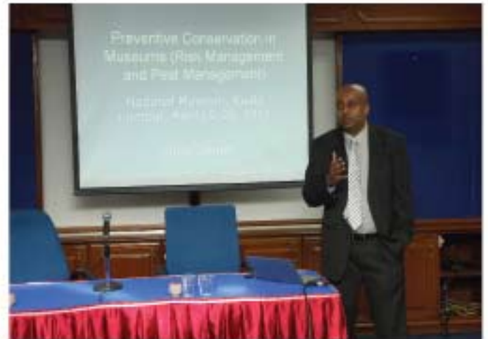
▲ Tenaga pengajar sedang memberikan penerangan.

Seterusnya, dari 3 hingga 5 Mei 2011, Bengkel Konservasi Preventif : Sokongan dan Simpanan Artifak telah diadakan bertempat di Bilik Persidangan JMM. Seramai 35 orang peserta yang terdiri daripada kurator, penolong kurator dan pembantu muzium telah menghadiri bengkel selama tiga hari ini. Konservasi Preventif didefinisikan sebagai tindakan yang dilakukan bagi menghalang pelapukan semula jadi objek akibat keadaan persekitaran seperti suhu, kelembapan, cahaya dan juga perosak seperti serangga, kulat dan pencemaran udara. Dengan mengikuti bengkel ini, peserta dapat mempelajari teknik-teknik melakukan konservasi preventif yang berkesan.