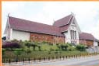
MUZIUUM NEGARA, KUALA LUMPUR