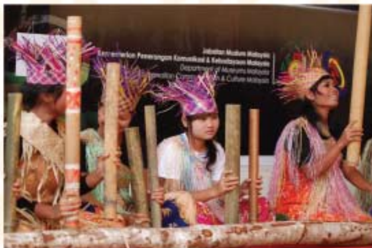
▲ Persembahan kebudayaan yang diadakan setiap hujung minggu sempena Karnival Orang Asli pada 20 Mei 2011 bertempat di Dataran Muzium Negara.