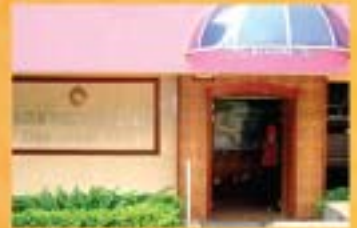
MUZIUUM SENI KRAF ORANG ASLI, KUALA LUMPUR