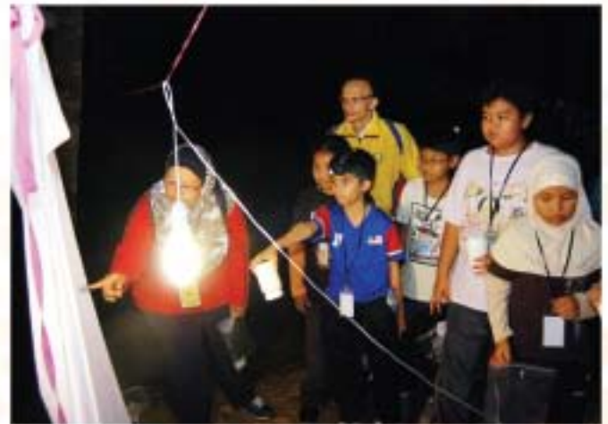
▲ YBhg. Dato' Ibrahim bin Ismail, Ketua Pengarah JMM turut serta meluangkan masa dalam program yang dilaksanakan.

Program yang menyediakan pelbagai aktiviti ilmiah secara santai itu telah disertai seramai 59 orang peserta dalam lingkungan umur 10 hingga 14 tahun dari empat buah sekolah sekitar Putrajaya, iaitu SMK Putrajaya Presint 14, SMK Putrajaya Presint 16, SK Putrajaya Presint 14 dan SK Putrajaya Presint 16.