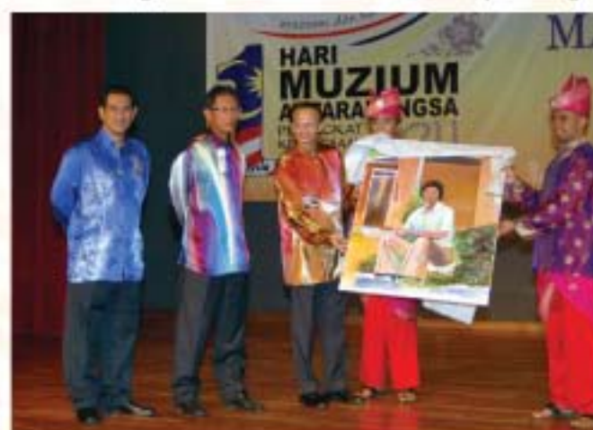
▲ Yang Berbahagia Dato' Ibrahim bin Ismail menyampaikan cenderamata kepada Yang Berhormat Datuk Mat Ali bin Hassan.