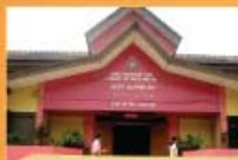
MUZIUUM ETNOLOGI DUNIA MELAYU, KUALA LUMPUR