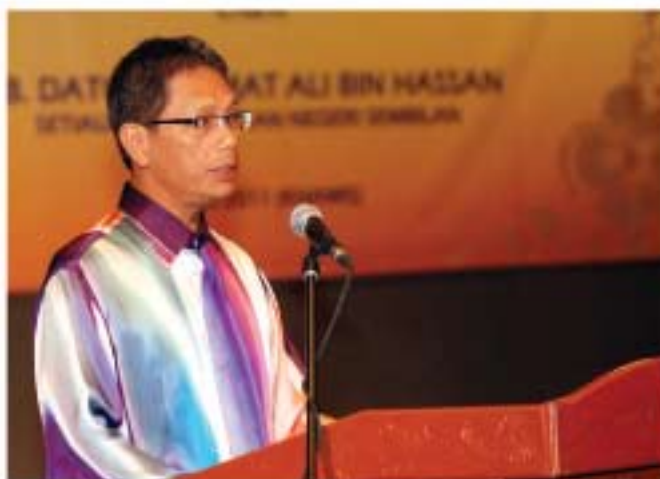
▲ Yang Berhormat Datuk Mat Ali Bin Hassan, Setiausaha Kerajaan Negeri Sembilan sedang memberikan ucapan di Majlis Perasmian sempena sambutan Hari Muzium Antarabangsa di Auditorium Jabatan Kebudayaan Negeri Sembilan.

Pada 19 Mei 2011, Majlis Perasmian Sambutan Hari Muzium Antarabangsa Peringkat Kebangsaan telah disempurnakan oleh Yang Berhormat Datuk Mat Ali bin Hassan, Setiausaha Kerajaan Negeri Sembilan di Auditorium Jabatan Kebudayaan Negeri Sembilan. Selari dengan tema sambutan pada tahun ini, Yang Berhormat Datuk Setiausaha Kerajaan Negeri Sembilan menyarankan agar muzium-muzium di seluruh negara terus menggiatkan pelaksanaan aktiviti yang menarik dan berkualiti bagi menarik lebih ramai pengunjung untuk mengunjungi dan seterusnya menjadikan muzium sebagai destinasi wajib dilawati. Majlis perasmian ini turut dimeriahkan dengan persembahan kebudayaan oleh artis kebudayaan Negeri Sembilan dan demonstrasi mengemping padi. Sejurus selesai Majlis Perasmian, para kenamaan telah dibawa ke perkarangan Muzium Negeri Sembilan bagi majlis pelancaran Pameran Khas Hari Muzium Antarabangsa Peringkat Kebangsaan 2011.