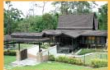
MUZIUUM KOTA JOHOR LAMA, JOHOR