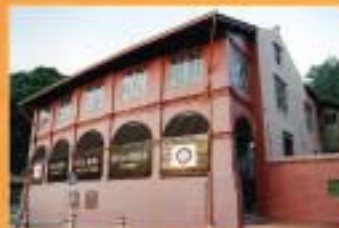
MUZIUUM SENI BINA MALAYSIA, BANDAR HILIR, MELAKA