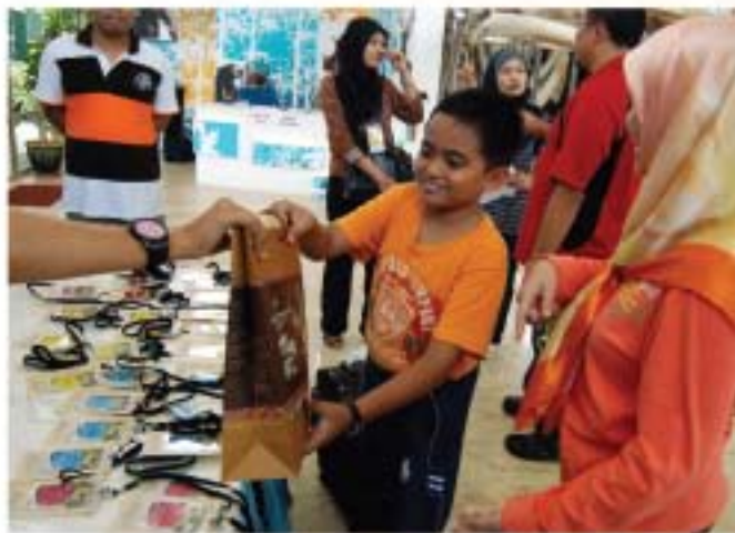
▲ Peserta mendaftar di kaunter pendaftaran sebelum memulakan aktiviti.

Antara aktiviti menarik yang disediakan ialah lawatan berpandu di muzium, tekanan daun, tayangan video, penangkapan serangga, pengawetan serangga, senam aerobik dan tutorial serangga. Aktiviti tersebut dijalankan secara berkumpulan dan setiap kumpulan dinamakan dengan menggunakan nama serangga bersesuaian dengan tema ditetapkan. Sijil penghargaan kepada para peserta disampaikan sendiri oleh Ketua Pengarah JMM, YBhg. Dato' Ibrahim bin Ismail yang turut meluangkan masa meninjau aktiviti yang dilaksanakan.