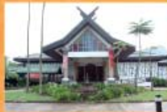
GALERIA PERDANA, LANGKAUI