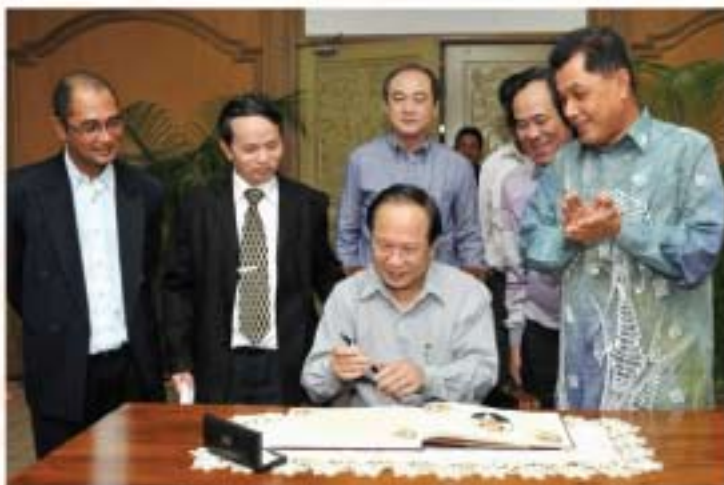
▲ Sesi tandatangan buku pelawat oleh Yang Mulia Hoang Tuan Anh, Menteri Kebudayaan, Sukan dan Pelancongan Vietnam ketika lawatan kerja beliau ke Muzium Negara pada 10 April 2011.