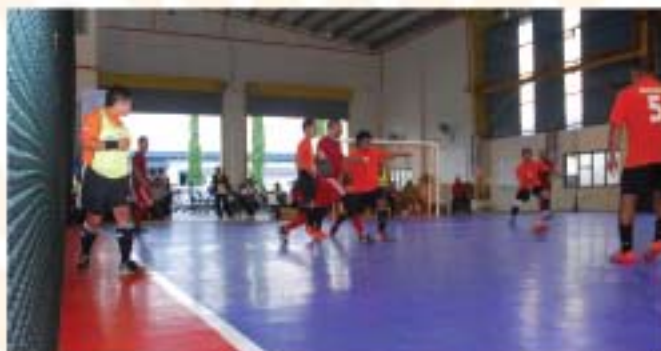
▲ Perlawanan futsal yang menyaksikan pasukan dari Zon Wilayah berentap menentang pasukan dari Zon Sarawak.