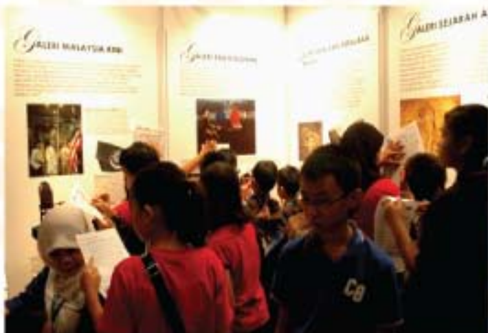
▲ Kelihatan gerai pameran JMM yang penuh sesak dengan kunjungan orang ramai untuk menyertai pelbagai aktiviti interaktif di Program Pameran JMM Smart Kids 2011 yang diadakan pada 15 - 17 April 2011 bertempat di Pusat Dagangan Dunia.