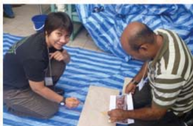
▲ Antara aktiviti - peserta dikehendaki melukis semula lukisan batu prasejarah yang terdapat di Thailand.