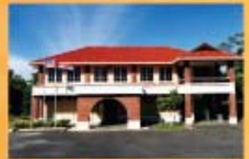
MUZIUUM CHIMNEY, LABUAN