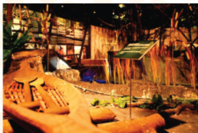
▲Sebahagian daripada sudut Pameran Orang Asli : Kepercayaan dan Tradisi

Jabatan Muzium Malaysia (JMM) dengan kerjasama Jabatan Kemajuan Orang Asli (JAKOA) telah menganjurkan Festival Orang Asli di Kompleks Jabatan Muzium Malaysia yang diadakan mulai 20 Mei 2011 hingga 21 Jun 2011. Program tersebut diadakan sebagai satu inisiatif kedua-dua jabatan untuk mengetengahkan keunikan tradisi serta kepercayaan Orang Asli kepada masyarakat umum. Di samping itu, program ini memberi peluang kepada para pelawat untuk mendekati masyarakat Orang Asli dan menghayati aspek-aspek kehidupan masyarakat ini ketika mereka sedang mengalami dinamisme selari dengan wawasan dan aspirasi negara menuju sebuah negara yang maju dan moden. Di sebalik penerimaan arus pemodenan, Orang Asli bagaimanapun masih tetap teguh memelihara warisan dan terus kental mempertahankan tradisi nenek moyang mereka.