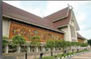
MUZIUM NEGARA KUALA LUMPUR