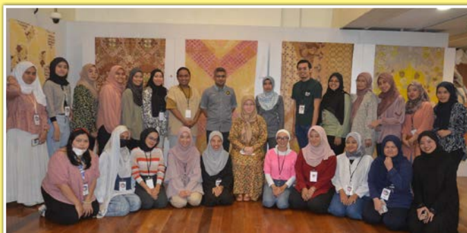
Tunku Hajah Azizah Aminah Maimunah Iskandariah Sultan Iskandar berkenan bergambar bersama kumpulan mahasiswa UiTM yang terlibat secara langsung dalam pameran DYECO : Eksplorasi Eko Tekstil Pewarna Alam di Muzium Tekstil Negara

Kunjungan Raja Permaisuri Agong ini telah memberi suntikan semangat kepada para mahasiswa yang terlibat untuk terus menghasilkan karya- karya yang berkualiti.