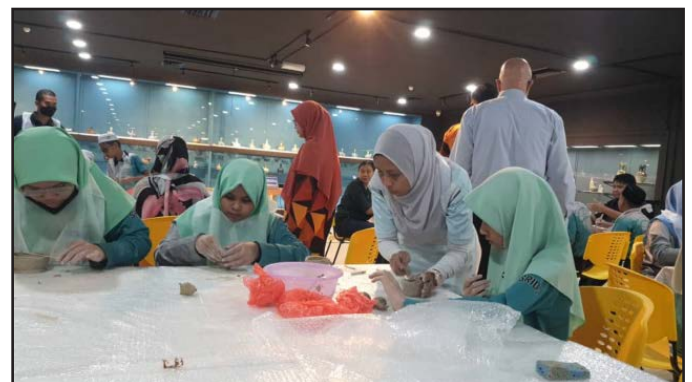
Para pelajar berpeluang membuat mini tembikar menggunakan asas teknik pembuatan seramik iaitu teknik picitan dengan dibantu oleh kakitangan MEDM.