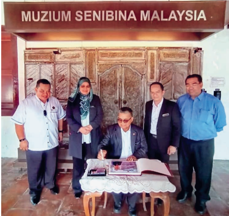
YB Menteri menandatangani buku pelawat VIP di Muzium Seni Bina Malaysia

Oleh: Sahrul Adli bin Mohd Yunan, Muzium Senibina Malaysia