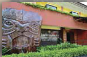
MUZIUM SENI KRAF ORANG ASLI KUALA LUMPUR