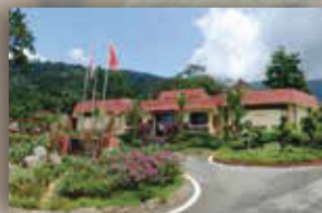
MUZIUM ARKEOLOGI LEMBAH BUJANG, KEDAH