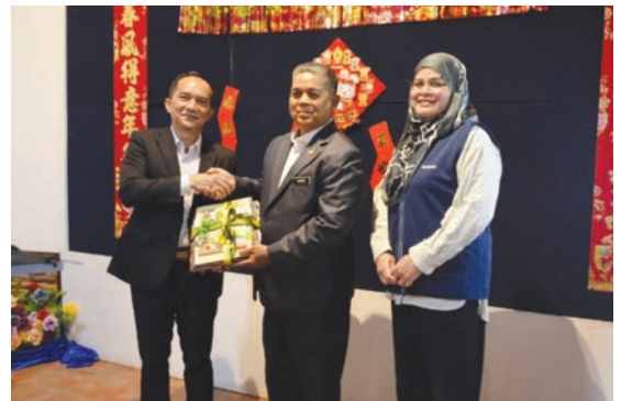
Timbalan Ketua Pengarah (Dasar) JMM menyampaikan cenderamata kepada YB Menteri sambil disaksikan oleh Ketua Setiausaha KPN