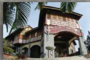
MUZIUM SUNGAI LEMBING PAHANG