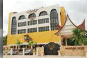
MUZIUM ADAT JELEBU, NEGERI SEMBILAN