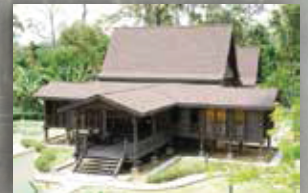
MUZIUM KOTA JOHOR LAMA JOHOR