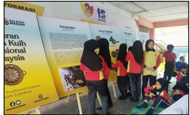
Para pelajar sedang membaca teks Pameran Acuan Kuih Tradisional Malaysia.