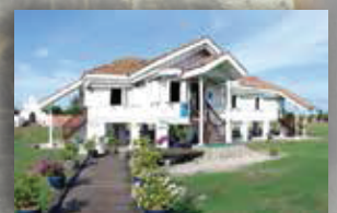
MUZIUM KOTA KUALA KEDAH KEDAH