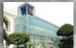
MUZIUM TEKSTIL NEGARA KUALA LUMPUR