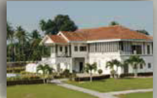
MUZIUM MATANG PERAK