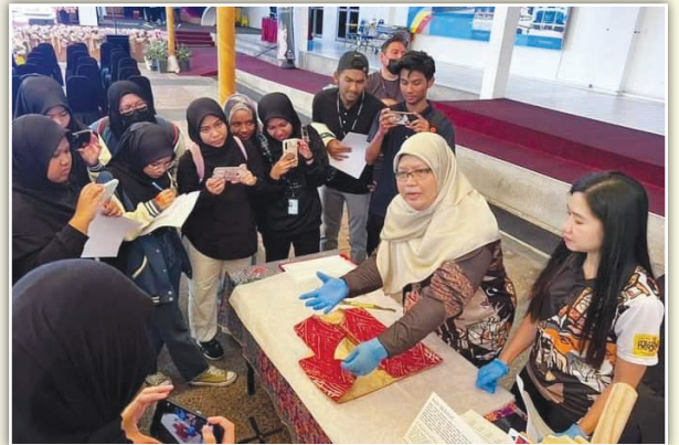
Taklimat dan demonstrasi berkaitan koleksi artifak pakaian yang disampaikan oleh kakitangan Muzium Negara.

Sepanjang program berlangsung, para pelajar telah diberikan taklimat berkaitan sejarah dan latar belakang muzium masing-masing. Selain itu, para pelajar juga turut diberi penerangan ringkas berkaitan pengurusan koleksi yang dilakukan oleh pihak muzium seperti