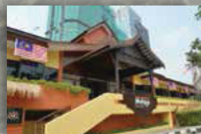
MUZIUM ETNOLOGI DUNIA MELAYU KUALA LUMPUR