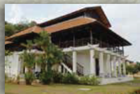
MUZIUM LUKUT NEGERI SEMBILAN