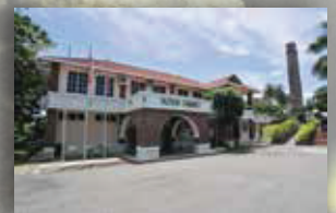
MUZIUM CHIMNEY LABUAN