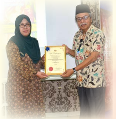
Majlis Penutup penyampaian sijil dan cenderahati kepada pembentang.