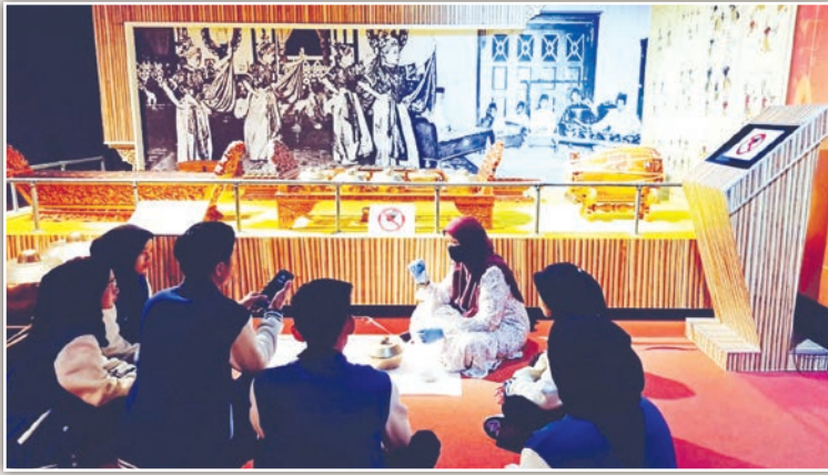
Para pelajar tekun mendengar taklimat dan demonstrasi pengukuran koleksi artifak alat muzik di Muzium Muzik.