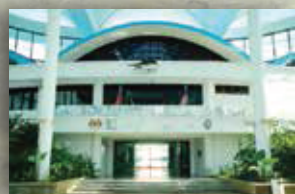
MUZIUM MARIN LABUAN LABUAN