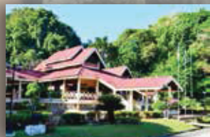
MUZIUM KOTA KAYANG PERLIS