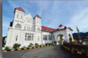
MUZIUM PERAK TAPING PERAK