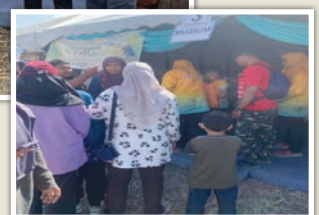
Pengunjung yang membanjiri reruai Muzium Kota Kayang dan pasukan Muzium Kota Kayang yang bertugas bagi program pesta angin timur tahun ini.