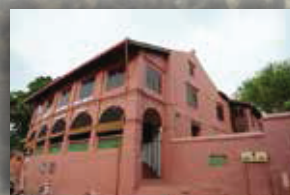
MUZIUM SENI BINA MALAYSIA BANDAR HILIR, MELAKA