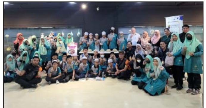
Peserta program yang terlibat bersama kakitangan UM STEM, Muzium Seni Asia, Muzium Etnologi Dunia Melayu dan Institut Kraf Negara.

KUALA LUMPUR - Program “Flipped Museum” yang diadakan di Muzium Seni Asia merupakan program rintis bagi Universiti Malaya STEM Centre (UM STEM) dengan kerjasama Muzium Etnologi Dunia Melayu (MEDM). Program ini menggunakan kaedah pembelajaran ilmu sains dan sosial secara kreatif dalam menarik minat kanak-kanak ke muzium. Pada 31 Januari 2023, seramai 35 orang pelajar dari Sekolah Rendah Islam Darul Ehsan terlibat dalam program ini. Terdapat pelbagai aktiviti yang dilaksanakan antaranya penerangan berkaitan artifak dan sesi kuiz yang dikelolakan oleh UM STEM dan Muzium Seni Asia serta demonstrasi mini tembikar oleh kakitangan Muzium Etnologi Dunia Melayu dan Institut Kraf Negara. Para pelajar turut berpeluang melaksanakan aktiviti membuat tembikar menggunakan teknik asas pembuatan tembikar iaitu teknik picitan dan teknik lingkaran dengan bantuan dan bimbingan kakitangan Muzium Etnologi Dunia Melayu dan Institut Kraf Negara. Program kerjasama ini diharap dapat membantu meluaskan jaringan kerjasama di antara institusi permuziuman dan agensi-agensi luar seperti Institut Kraf Negara dan sebagainya.