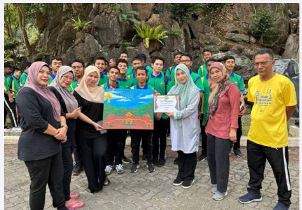
Penyampaian cenderamata berbentuk lukisan Muzium Kota Kayang yang dilukis sendiri oleh pelajar Sekolah Menengah Agama Ad-Diniah.

Program pendakian seumpama ini mampu meningkatkan kecergasan diri pelajar-pelajar, disamping menambah ilmu pengetahuan tentang sejarah negeri Perlis dan menghargai alam semulajadi di sekitar mereka.