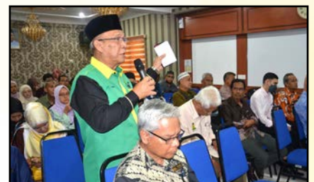
Sesi soal jawab peserta kepada pembentang.