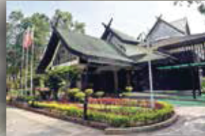
GALERIA PERDANA LANGKAWI