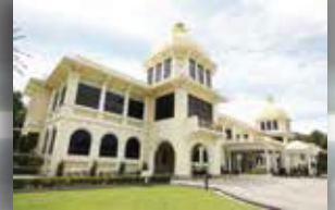
MUZIUM DIRAJA KUALA LUMPUR