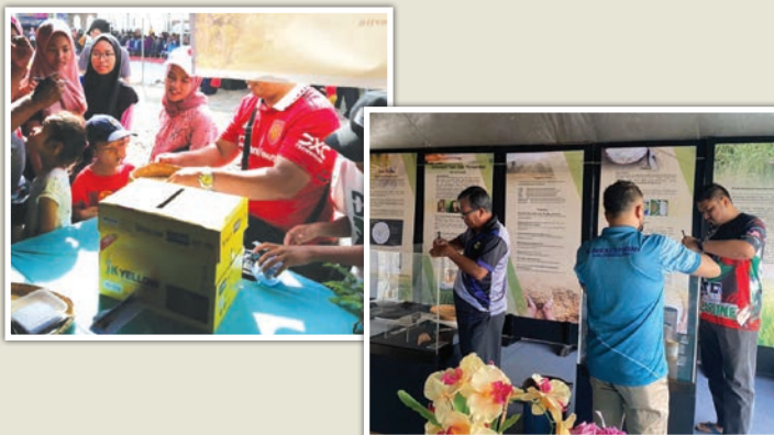
Pengunjung yang membanjiri reruai Muzium Kota Kayang bagi menyertai kuiz teka berat padi.

Program Pesta Angin Timur ini secara dasarnya mencapai objektif utama yang disasarkan iaitu mempromosi dan menyemarakkan aktiviti kebudayaan, kesenian dan warisan tempatan kepada pelancong domestik serta antarabangsa, di samping, mempromosikan industri pelancongan di negeri Perlis serta meningkatkan kefahaman apresiasi seni budaya kepada segenap lapisan masyarakat kearah pembentukan perpaduan bangsa yang harmoni sesuai dengan hasrat Malaysia Madani.