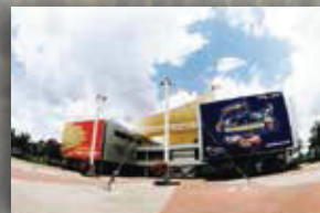
MUZIUM AUTOMOBIL NASIONAL SEPANG