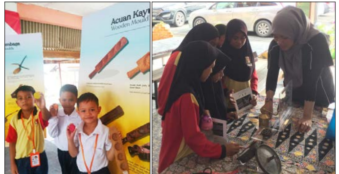
Pelajar Tahun 1 menunjukkan hasil daripada aktiviti yang disertai.