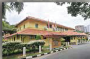
MUZIUM LABUAN LABUAN