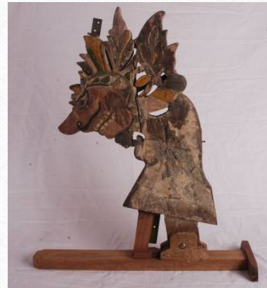
Bangau Perahu Payang Kuala Setiu, Terengganu 1975, Kayu cengal, 47cm x 71 cm

Bangau pada perahu Payang selalunya menggunakan watak wayang kulit Jawa tetapi dalam sesetengah contoh kepala naga besar turut digunakan dan dihiasi dengan corak daun menggantikan watak wayang kulit.